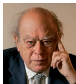
Jordi Pujol president de la Generalitat de Catalunya (1980-2003)