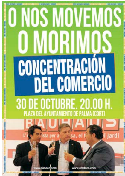
Cartell que convoca a la insòlita manifestació d'empresaris del petit i mitjà comerç.

Les dues patronals consideren que l'executiu de Bauzá podria fer més del que fa. Segons han dit els dos màxims