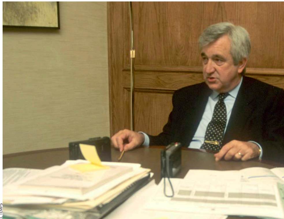
En el temps de Cañellas l'espanyolisme del PP era larvat, el president s'estimava més no fer guer-

A partir d’aleshores s’anomenà a Mallorca gonellisme el corrent que nega la unitat lingüística. Entre els anys setanta i els noranta fou eminentment social, un corrent que s’expressava a través dels mitjans de comunicació, i sempre aïlladament, de poca gent. A finals de la dècada dels noranta intentà