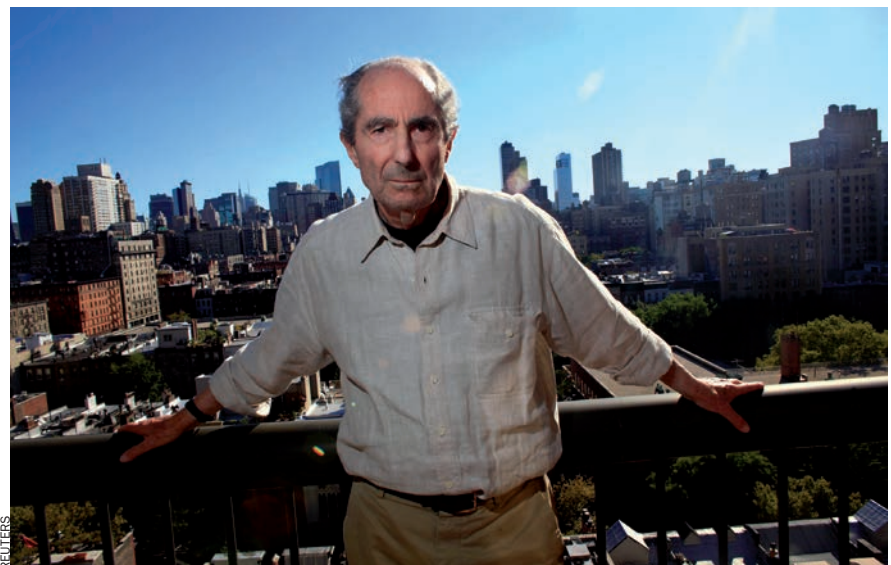
El novel·lista nord-americà Philip Roth estèn i reforça la seva obra en català a l'editorial La Magrana.

En un moment que els llibres que no causen un gran impacte es venen menys que mai i passen desapercebuts, la política d'autor ajuda a reforçar la popularitat de tots i cadascun dels títols d'un mateix escriptor i, per tant, a obtenir una clientela fixa i fidel. Les editorials han descobert que els autors que fan forat són seguits amb devoció si es publiquen les seves novetats amb regularitat i, a més, es recuperen títols antics, com ha estat el cas de Philip Roth a la Magrana.