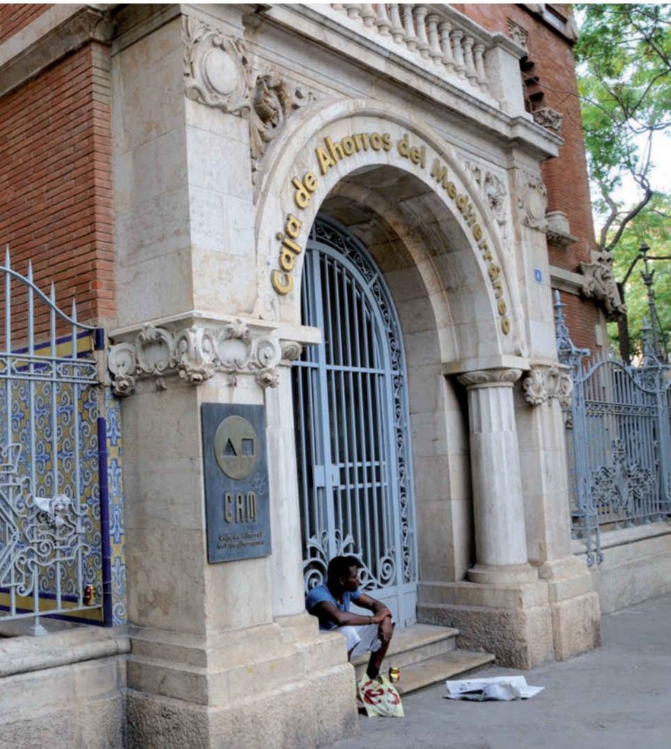
cada de fa un any i mig.

més feient és en l'obra social de les caixes. La situació en què es troben les antigues Bancaixa i CAM ha provocat que ara per ara el futur de les obres socials de totes dues entitats estiga en l'aire. Pel que respecta a la segona, la conversió de la caixa en fundació de caràcter especial està estancada i els responsables del Sabadell s'han limitat a afirmar que estan disposats a assumir només alguns dels compromisos de la CAM. Pel que fa a la primera, encara no és del tot clar d'on provindran els fons per a mantenir-la viva. De moment, la Fundació Bancaixa disposa de 80 milions amb els quals es poden cobrir no més d'un parell de campanyes de l'obra social. Exposicions com la que va permetre passejar les pintures de Joaquim Sorolla per mig Espanya són ja història.