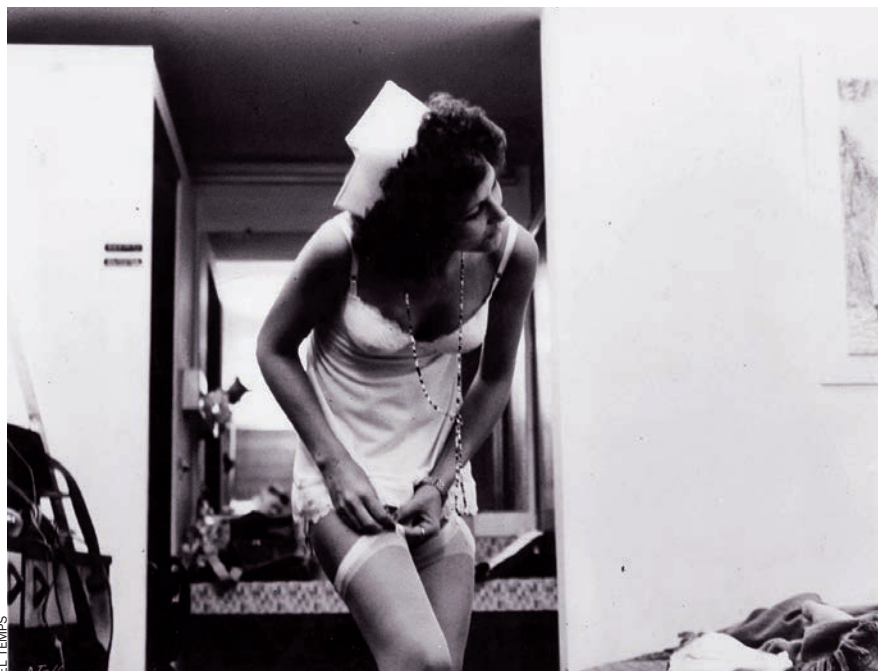
Linda Lovelace, caracteritzada per a 'Deep Throat'.

D urant cinc minuts, els crèdits i ella, que puja al cotxe i va conduint. Cinc minuts amb la betthoveniana Oda a l'alegria de música de fons. En versió psiquedèlica, això sí. Tot molt setantaire. Cinc minuts de rellotge i una mica més. Fins que Linda arriba a casa i troba la mare a la cuina. No duu davantal ni prepara pastissos: seu a la taula, amb les cames obertes i cara de tedi mentre un xicot s'escarrassa a practicar-li un cunnilingus. Vet aquí el començament de Deep Throat ( Gola profunda ), un film pornogràfic que va esdevenir fenomen de masses.