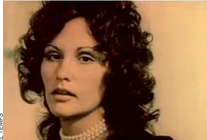
Algunes escenes de Deep Throat . El film va tenir pressupost reduït i va aconseguir beneficis astronòmics.

la pornografia es va fer encès. Celebritats de tota mena assistien a les projeccions. Veure Deep Throat es va convertir en una espècie d’acte de protesta. O de gest de modernitat. Era la pel·lícula que les parelles de classe mitjana nord-americanes veien juntes. I sense vergonya de ser trobats pels veïns al cinema. “Els mitjans de comunicació”, escriu Casto Escópico, “van tenir un paper decisiu en el llançament comercial del cinema porno. En la seva defensa de la llibertat d’expressió, determinada premsa liberal va arribar a sobrevalorar la qualitat artística del film de Damiano i el mateix fenomen de la pornografia”. Vet aquí l’agosarada afirmació d’un cronista encès de The New York Review : “La pornografia és el més important esdeveniment artístic d’aquesta dècada”.