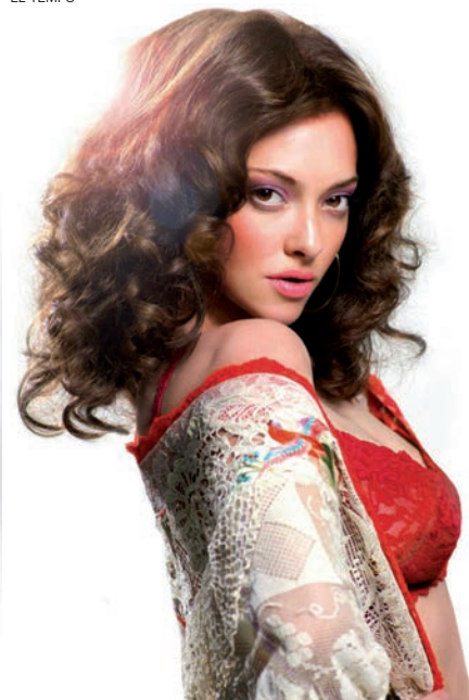
Tres rostres per a una història: Malin Akerman, la mateixa Linda Lovelace, i Amanda Seyfried, caracteritzada per al personatge.

Linda Lovelace no va participar directament dels enormes beneficis que va generar aquella cinta. Els seus honoraris van ser uns escarits 1.250 dòlars (que, a sobre, va cobrar el marit). “Però m’he fet famosa”, comentava ella, d’entrada, amb un somriure. Pocs anys després va explicar l’altra cara d’aquella moneda. I es va convertir, de fet, en una activa propagandista antipornografia: “Quan vostès miren Gola profunda ”, va declarar davant d’una comissió creada per l’administració de Ronald Reagan, “em veuen a mi essent violada. És un crim que aquella pel·lícula es continuï projectant; durant tota l’estona tenia una pistola apuntant-me al cap”.