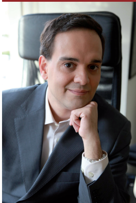
Adrián Sack La Nación