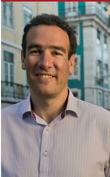
Raphael Minder The New York Times