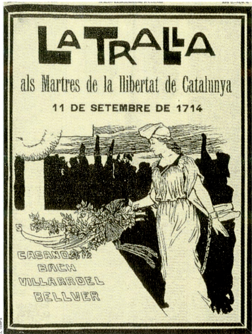
Número extraordinari de la revista La Tralla del 10 de setembre del 1904, en homenatge als màrtirs de l'11 de setembre del 1714.

El funeral, diu l'historiador Pere Anguera, comptà amb una ben difosa crida i concità de forma automàtica l'obstrucció per part de les autoritats militars i eclesiàstiques. Tingué, doncs, una arrencada més elegíaca que no pas combativa, més de recordança, d'homenatge al passat que no de crit d'inci-