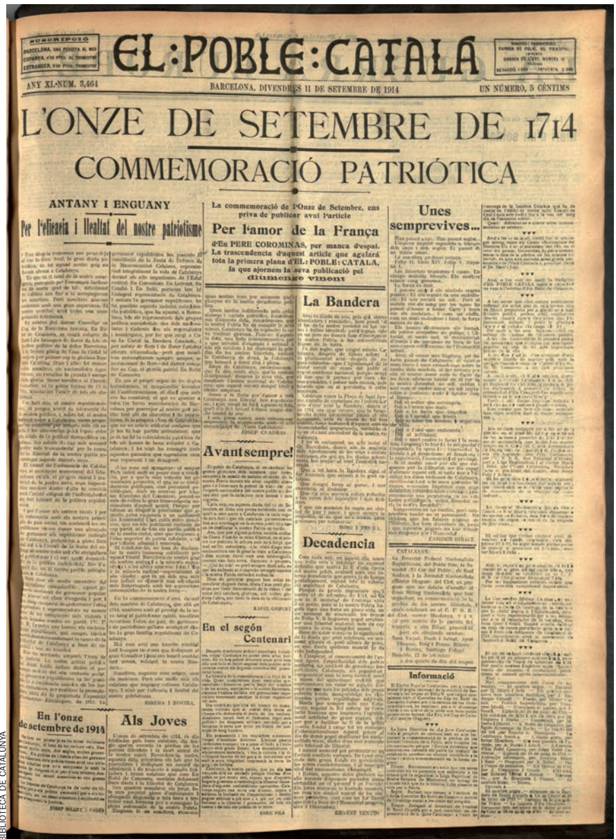
BIBLIOTECA DE CATALUNYA

El miting del CADCI. A l'acte central de la Diada, a la nit, al CADCI, s'esperava sentir-hi totes les branques del