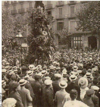
El dia 11 de setembre del 1914 la gent envolta l'estàtua de Rafael de Casanova –colgada de flors–, acabada d'instal·lar a la ronda de Sant Pere.

El 1914, amb el trasllat de l'estàtua de Rafael Casanova a l'emplaçament actual, és una data clau en la història de les commemoracions de l'Onze de Setembre.