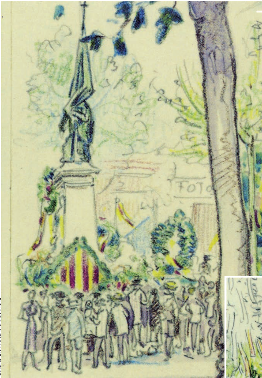
PUBLICACIONS DE L'ABADIA DE MONTSERRAT