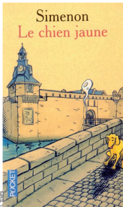
Coberta de l'actual edició de butxaca de Le chien jaune (Pocket).

"Maigret –escriu el prologuista– posseeix justament aquesta forma de sensibilitat, doblada d'una mena de plasticitat, que li permet de sentir els éssers, entrar en la pell d'un personatge i viure una mica la vida del sospitós, ni que sigui fugisserament,