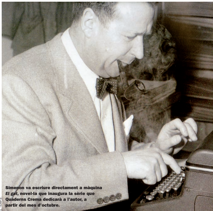
Simenon va escriure directament a màquina El gat , novel·la que inaugura la sèrie que Quaderns Crema dedicarà a l'autor, a partir del mes d'octubre.