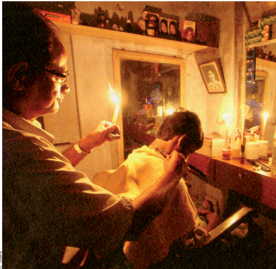
De resultes de l'apagada de corrent elèctric de final de juliol a l'Índia, serveis bàsics com ara l'atenció mèdica hi van resultar perjudicats.

Gairebé deu partits corregents han frenat el seu ímpetu i ara ha de buscar el vot solidari de partits diversos en molts estats federats. Es tracta d'un procés molt dur que l'obliga a establir molts compromisos. Sonia Gandhi, la gran dama del Congrés, es resisteix a una clara ruptura amb els vells ideals socialistes. Italiana de naixement, vídua de Rajiv Gandhi –primer ministre assassinat– i nora d'Indira Gandhi,