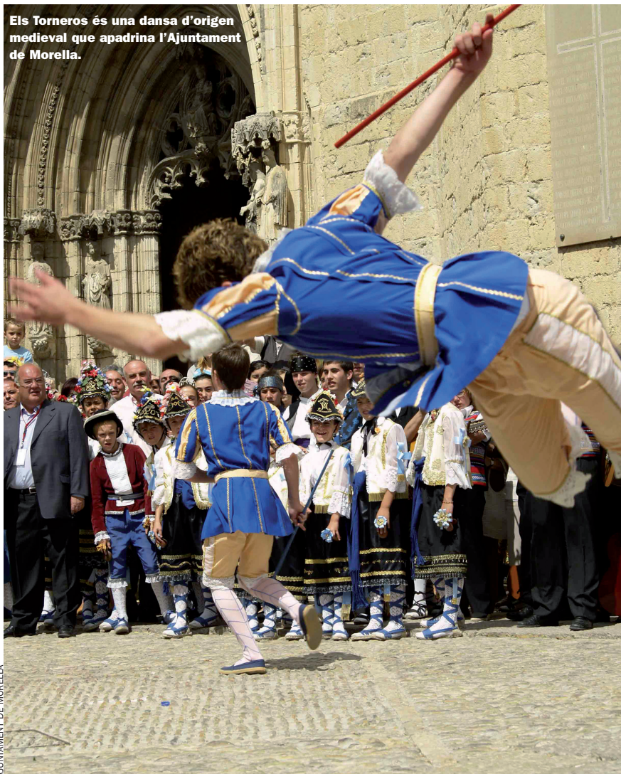
Els Torneros és una dansa d'origen medieval que apadrina l'Ajuntament de Morella.

Més festius i originals són els Volantins, un altre element del carrer de la Font, que consisteix en tres ninots dansaires col·locats en un pal mòbil que travessa el carrer de banda a banda uns quants metres per damunt. O la taula parada cap per avall, amb paella inclosa, que penja, també elevada, a la plaça de Tarrascons.