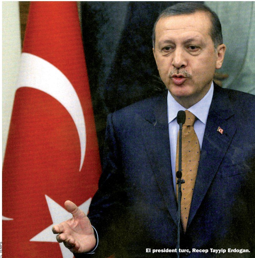
El president turc, Recep Tayyip Erdoğan.

Aquest pla decidit i ambiciós ha suscitat molt d'enrenou a Europa i als Estats Units, perquè Turquia també vol omplir les vitrines de la nova exposició amb peces que encara no posseeix, objectes