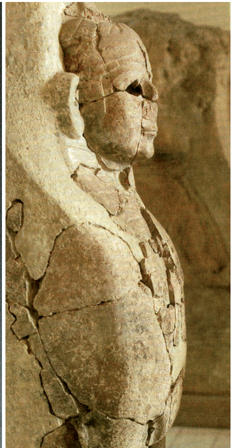
Aquest vas d'argent és un dels 18 objectes que Turquia reclama al Metropolitan de Nova York. A la dreta, esfínx de pedra que el Museu de Pèrgam de Berlín va haver de retornar a Turquia.