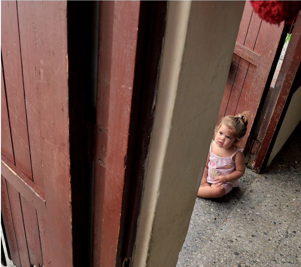
diagnosticar trastorn de dèficit d'atenció o depressió.