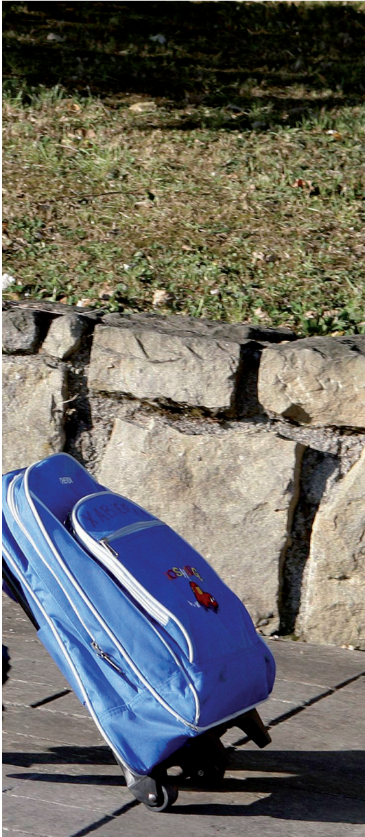
una malaltia psíquica.”

més privacions poden desenvolupar-se amb normalitat si després passen a viure en un entorn més favorable. A més, va fer un estudi en què es demostra que al segon any de vida es produeix una espècie de programa d'encarnació en què el vocabulari del xiquet s'eixampla sobtadament i comença a desenvolupar l'empatia, el sentit de la moralitat i la consciència de la personalitat.