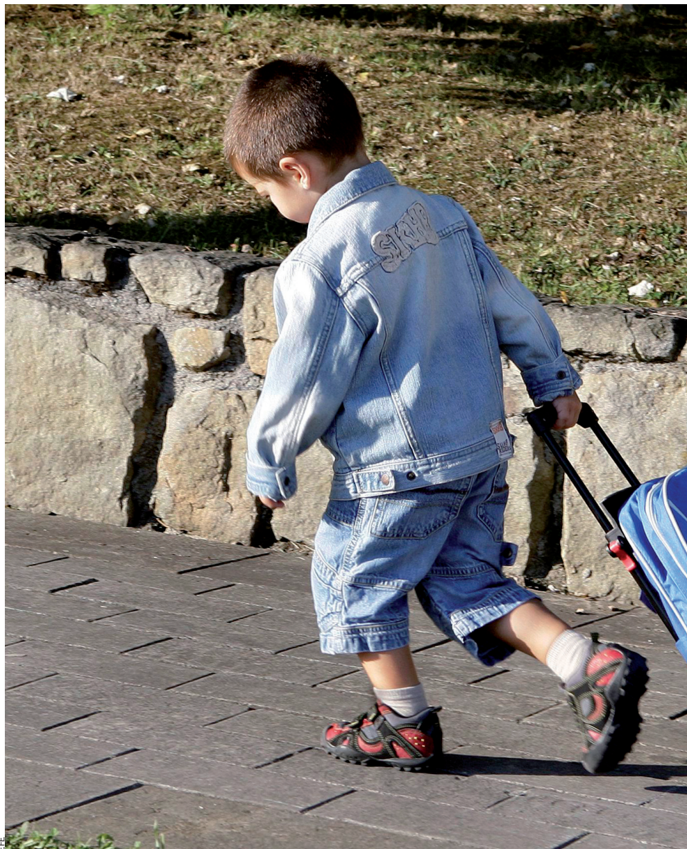
“És ridícul de considerar que tots els xiquets que mostren signes de depressió o ansietat tinguen