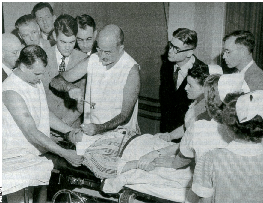
La lobotomia (secció dels lòbuls cerebrals centrals) fou considerada durant anys el remei més eficaç contra l'esquizofrènia i més malalties psíquiques.

—Els problemes que descriuiu no són nous. Per què diagnosticueu precisament ara una crisi dins la psiquiatria?