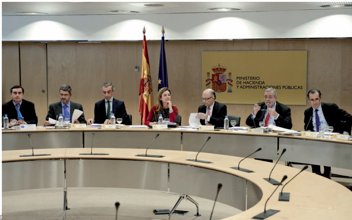
Reunió del Consell de Política Fiscal i Financera del passat gener, encapçalada pel ministre Cristóbal Montoro.