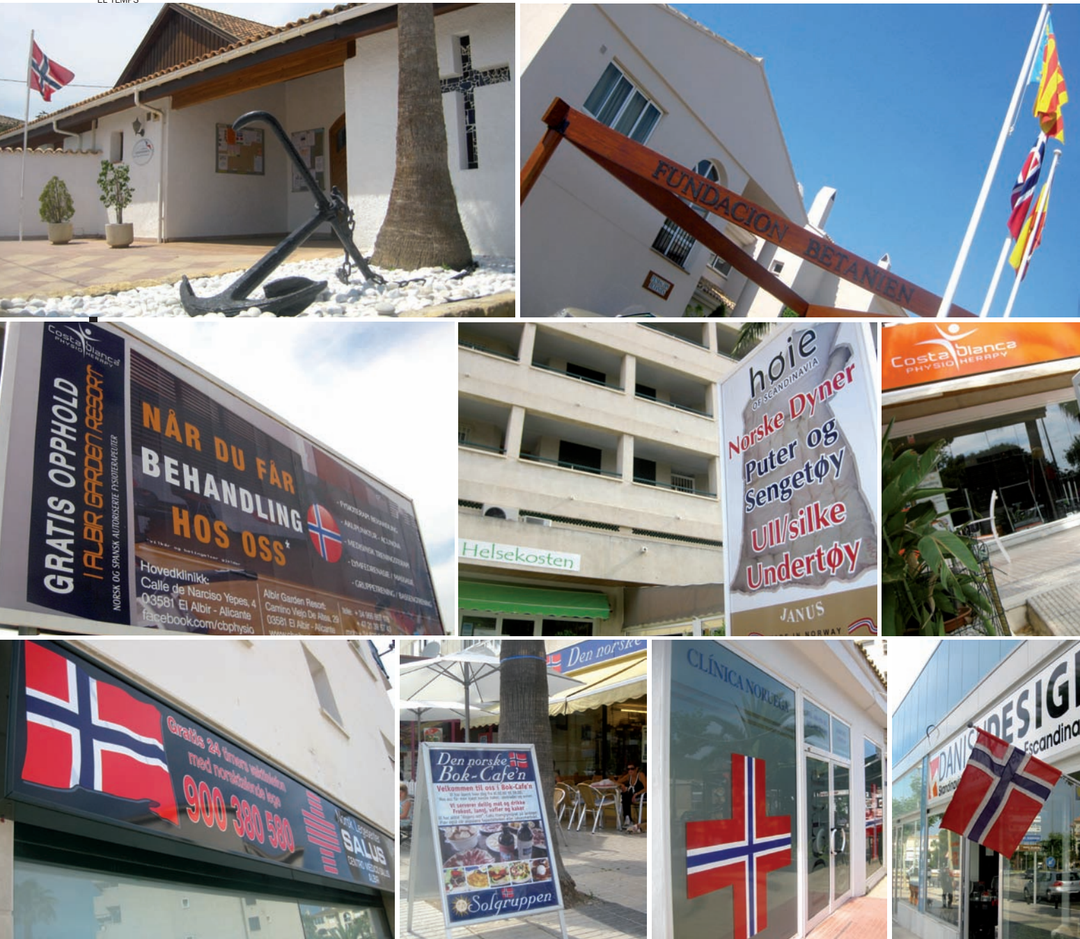
A la filera de dalt, l'església noruega, la residència Betanien, el col·legi públic noruec i el centre de voluntariat. A sota, tot de comerços de l'Alfàs del

possibilitat d'anar a Benidorm en pocs minuts també resultava molt suggeridora: hi pots trobar de tot, encara que jo noestic gens acostumada a veure gratacels i encara m'impacten una mica”.