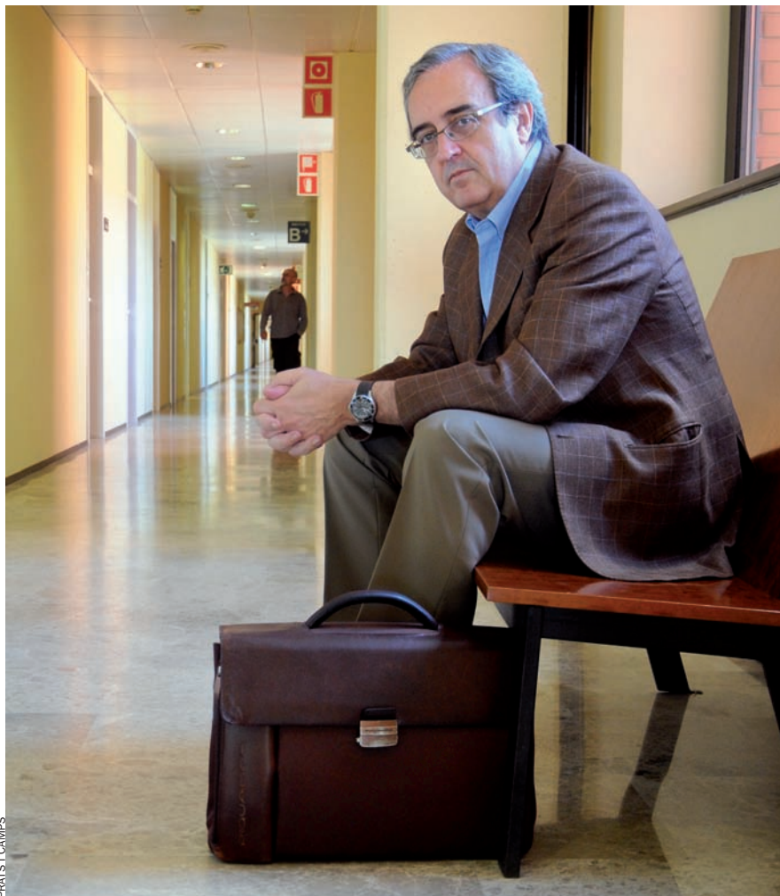
PRATS I CAMPS