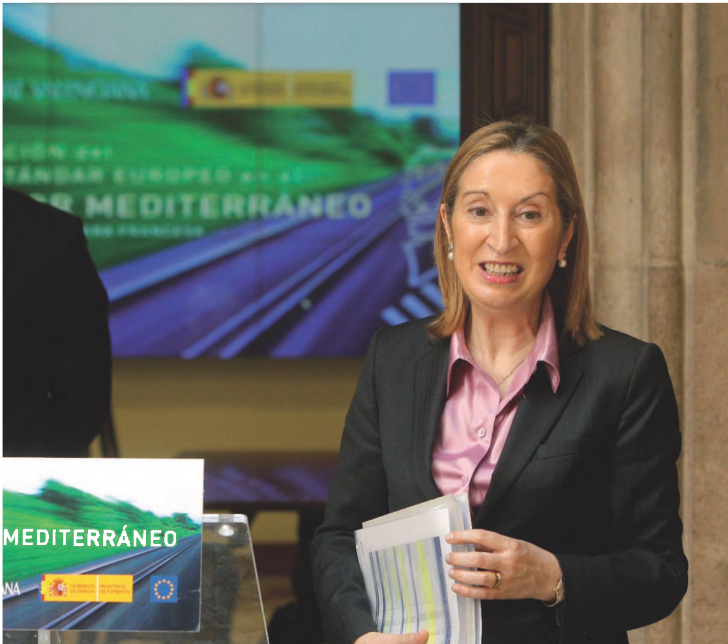
Foment, Ana Pastor, durant la seua visita a València. Darrere, el president de la Generalitat, Alberto Fabra.

diferent del de la resta del continent, la qual cosa originava dificultats en el transport de mercaderies més enllà dels Pirineus) a amplada de via internacional. La solució que es proposa és simple: es tracta de col·locar un tercer fil entre els dos de la via d'amplada ibèrica, de manera que la nova via, dotada de tres fils, permeta la circulació de combois d'amplada ibèrica i d'amplada europea (vegeu gràfic a la p. 58). Amb aquesta solució es podrien liquidar les incomoditats que ara per ara origina, a la frontera amb l'estat francès, la incompatibilitat