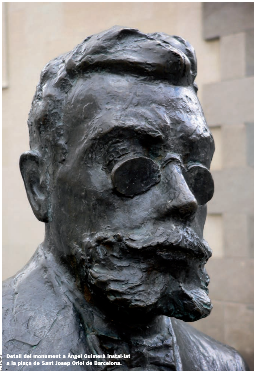
Detall del monument a Àngel Guimerà instal·lat a la plaça de Sant Josep Oriol de Barcelona.