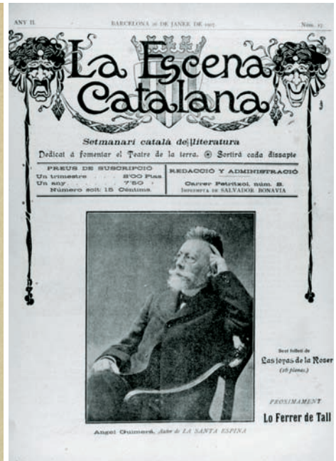
L'autor de Maria Rosa és un dels dramaturgs més populars del seu temps. Apareix sovint a les portades de la premsa.

de la Universitat d'Uppsala i autor dels diccionaris suec-català i català-suec.