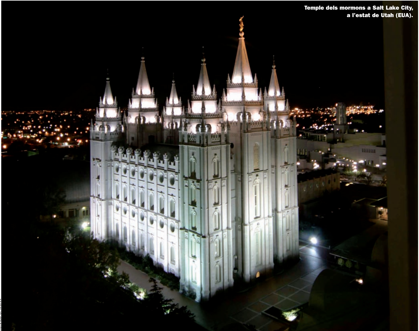
Temple dels mormons a Salt Lake City, a l'estat de Utah (EUA).