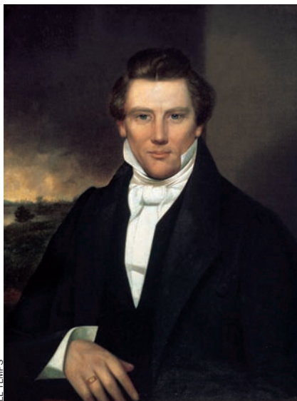
Joseph Smith, fundador del mormonisme.

Smith era un llaurador pobre que amb prou feines si sabia llegir i escriure. Afirmava que primer se li havien aparegut Déu i Crist, i més tard l'àngel Moroni li havia ensenyat el lloc on s'amagaven unes planxes d'or en què es descrivia la nova religió en egipci