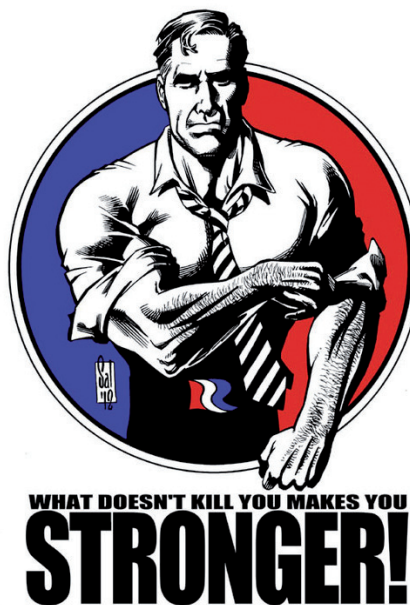
Il·lustració de Sal Velluto.

No obstant això, Romney és massa prudent sobre les seues habilitats professionals, per culpa de la influència que exerceix en ell la seua fe. Els seus companys l'animen a començar a parlar de les seues creences, de la història de la seua família a Mèxic, de la poligàmia que abans era habitual, de la seua religió i la relació que té amb els Estats Units, amb l'objectiu d'aconseguir que els republicans devots facen les paus amb ell.