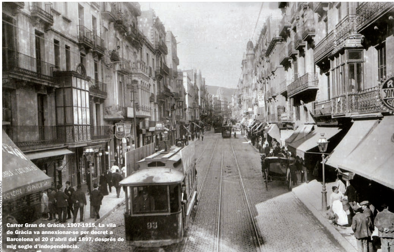
Carrer Gran de Gràcia, 1907-1915. La vila de Gràcia va annexar-se per decret a Barcelona el 20 d'abril del 1897, després de mig segle d'independència.