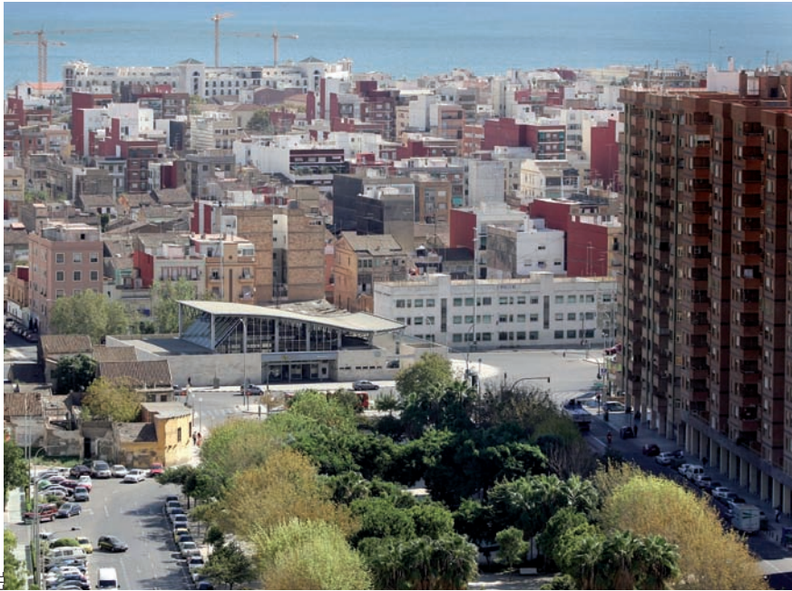
Durant vuit segles, el Cabanyal fou un poble de pescadors. Entre els anys 1836 i 1897 va ser un municipi independent, Poble Nou de la Mar, fins que fou annexat a València.