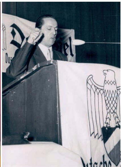
Werner Naumann, ex-secretari d'estat del ministre de Propaganda nazi Joseph Goebbels.