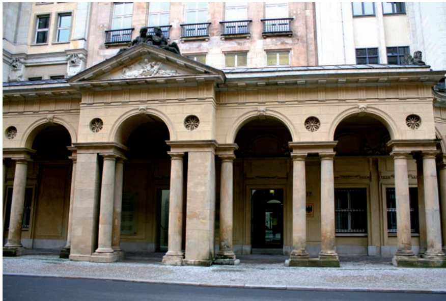
Otto Ohlendorf, autor de milers d'assassinats de jueus, fou condemnat i executat. A la dreta, edifici del Ministeri de Justícia alemany.

pecials d'un gitano." No va ser fins a una dècada després del final de la guerra que el BKA no va incloure el número de presoner tatuat al braç d'un presumpte delinqüent al seu perfil de recerca.