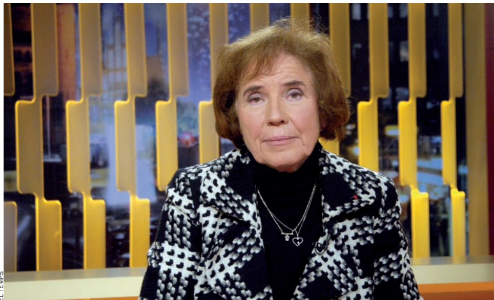
Beate Klarsfeld va clavar una bufetada al canceller Kurt Georg Kiesinger i l'acusà de nazi en públic.

Quan, el gener del 1951, a Bonn es va escampar el rumor que els nord-americans planejaven l'execució dels genocides nazis que hi havia empresonats a Landsberg i ja havien estat condemnats a mort, l'alcalde