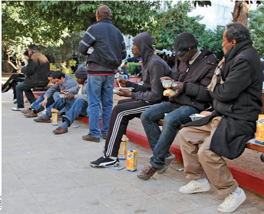
Immigrants menjant en una plaça d'Atenes.

Habiten el centre de la ciutat i poden arribar a ser unes 100.000 persones.