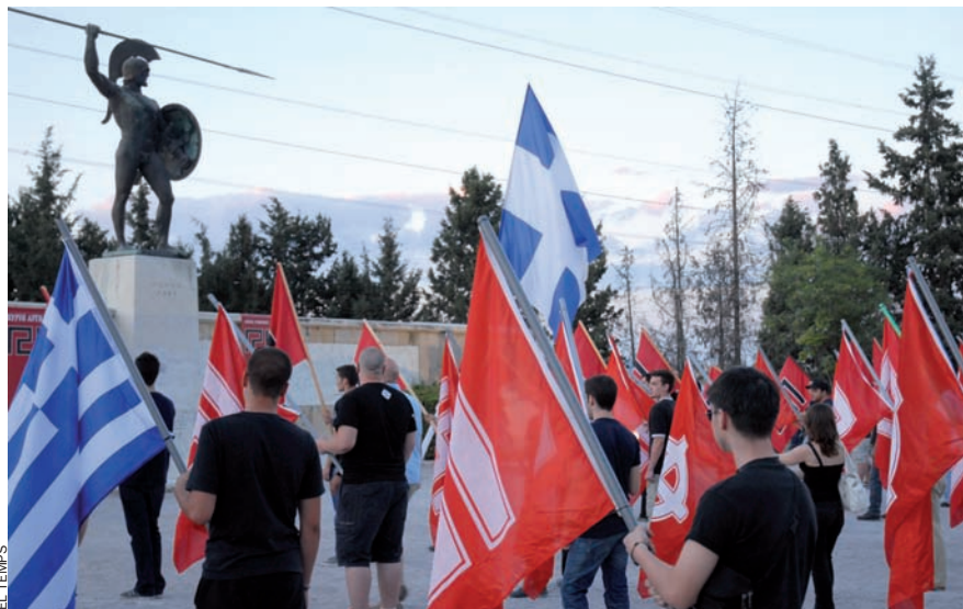
Cerimònia de Khrisi Avgí ('Alba Daurada'), partit neonazi grec molt actiu i violent.

Al bar on ens trobem ara no hi ha ningú. Al costat de la caixa penja un número de telèfon, una mena de trucada d'emergència, segons que ens conta el propietari del bar de souvlaki , un plat de carn popular a Grècia. Si se sentís amenaçat marcaria el número i llavors