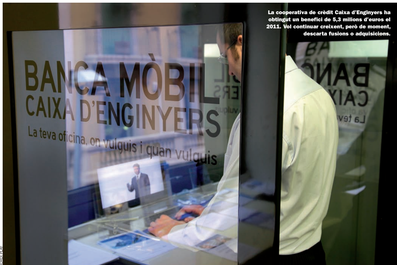
La cooperativa de crèdit Caixa d'Enginyers ha obtingut un benefici de 5,3 milions d'euros el 2011. Vol continuar creixent, però de moment, descarta fusions o adquisicions.