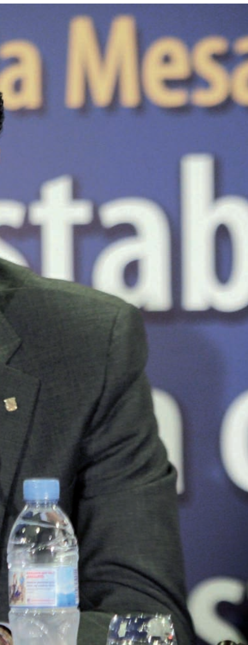
crear contradiccions dins el PSIB-PSOE.

ra esmentada, Bauzà comença canviar ràpidament. La seva actitud ja no és la de cercar el consens amb els qui li havien donat suport a l'hora de prendre decisions. Al contrari, es considera amb prou suport de la militància per a no fer cas dels antics aliats. Fins al punt que en una tensa reunió, l'estiu del 2010, importants dirigents del partit li demanaren que cercàs més el consens. Digué que sí. Però continuà igual.