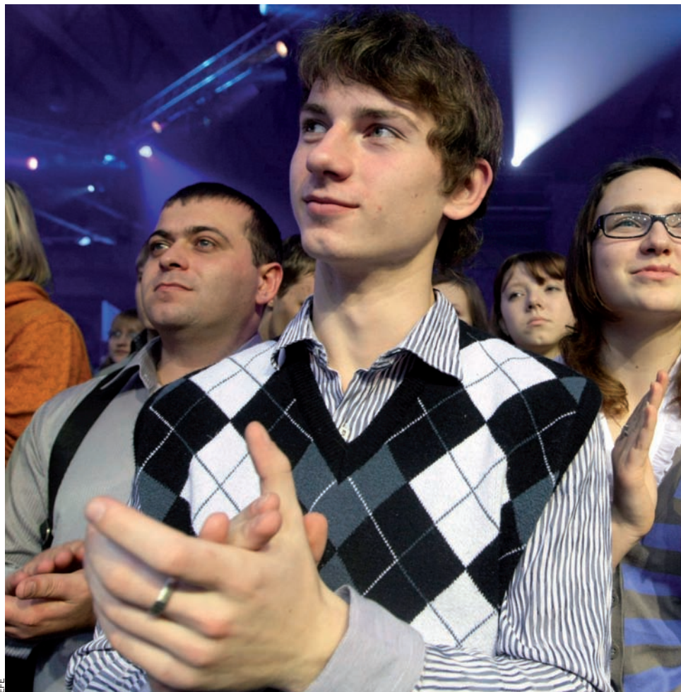
Joves seguidors de Putin aplaudeixen durant el congrés del moviment juvenil Naixi, el 2010.