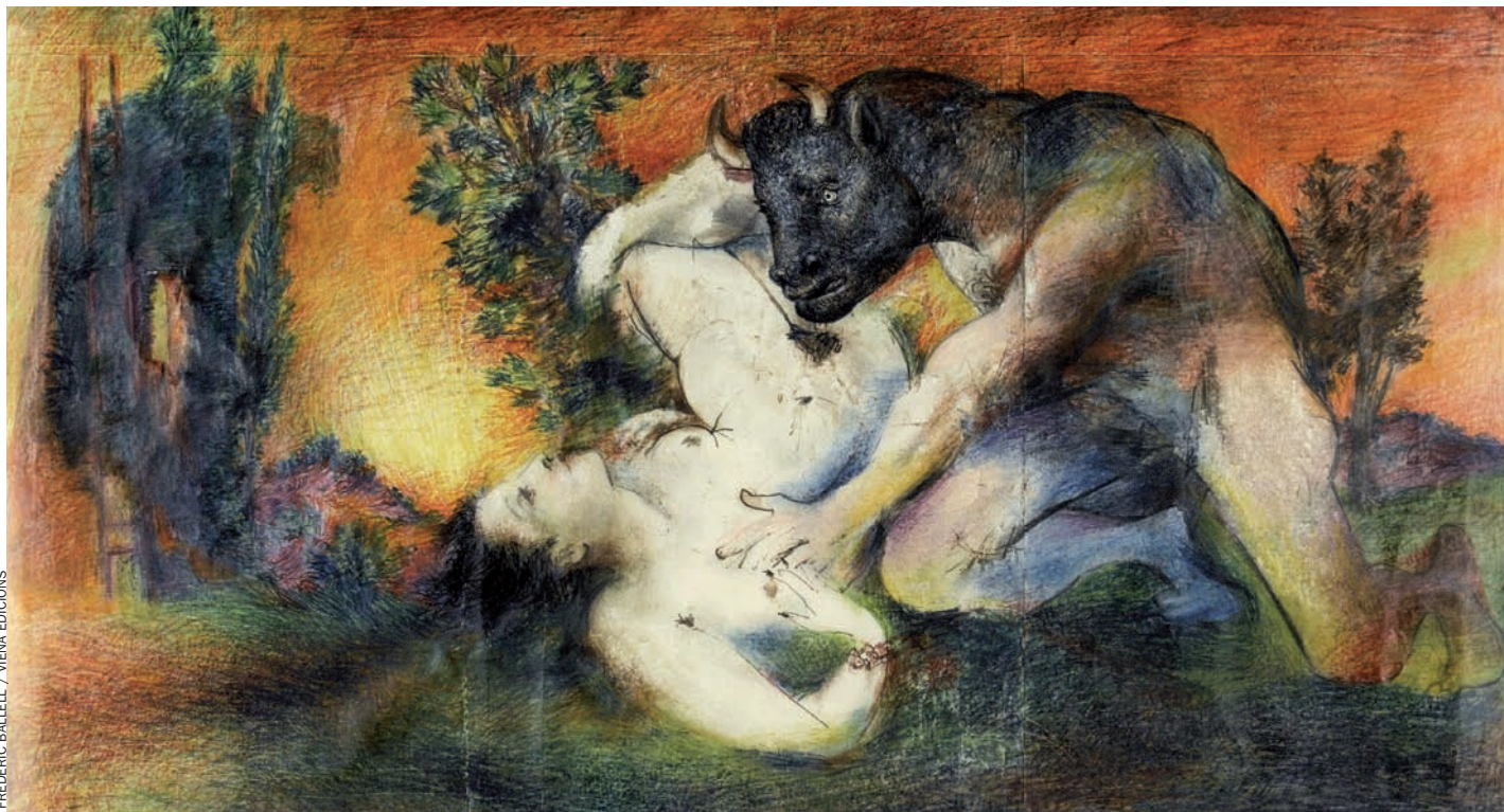
FREDERIC BALLELL / Viena Edicions