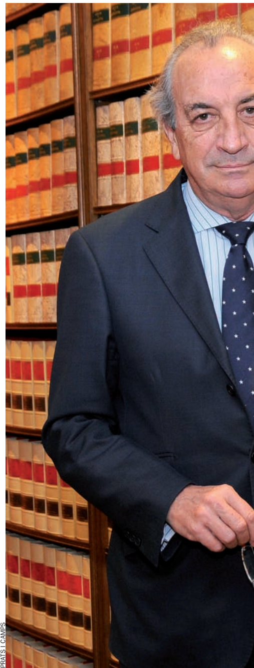
FRATIS I CAMPS

Finalment, hi ha una qüestió que pot semblar un poc sentimental i fallera, però que no s'hauria de perdre de vista: l'arrelament al territori. Aquí, a molta gent en