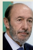
A. Pérez Rubalcaba