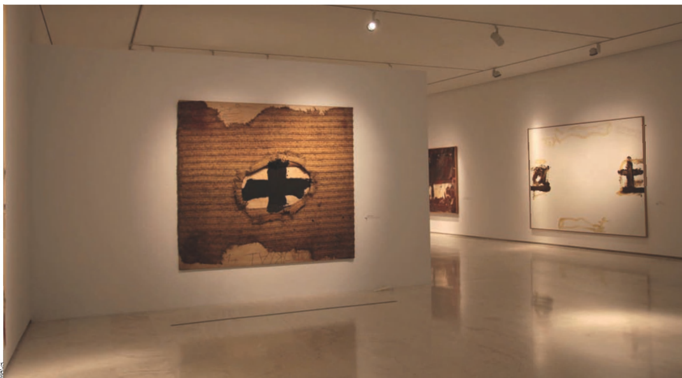
El Museu d'Art Contemporani d'Alacant exhibeix actualment la mostra "Dual-s. Tàpies davant Tàpies".

L'homenatge del 2003. Devien sentir-se envejosos de València, de l'estreta relació de Tàpies amb la ciutat de València. A les dotze del migdia del dissabte 25 d'octubre del 2003 es van aplegar al claustre de l'edifici de la Nau de la Universitat de València nombrosos artistes i admiradors de Tàpies amb la intenció d'homenatjar-lo, amb motiu del seu vuitantè aniversari.