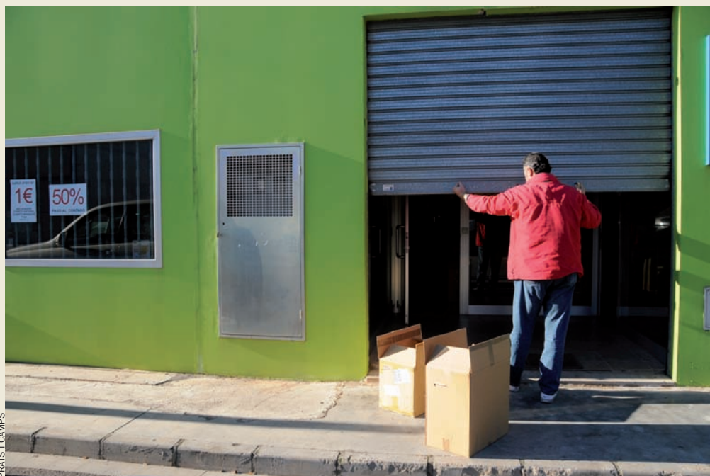
V. Ll. tanca l’empresa de papereria per a emigrar al Paraguai.

Fa dos anys, però, les coses començaren a canviar. Alguns clients començaren a pagar tard; alguns altres no pagaven; i uns altres simplement deixaren de fer-li comandes. “Fins fa dos anys mai no havia tingut cap