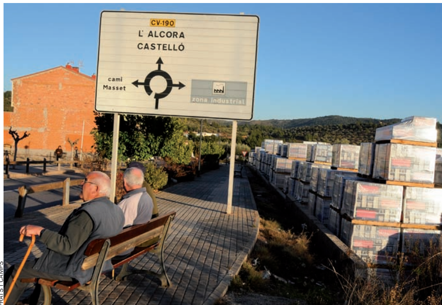
Un grup de gent gran vora una fàbrica de taulells, prop del municipi de l'Alcora (Alcalatén).

El cas d'Agustín és paradigmàtic del procés de descapitalització que ha viscut aquest territori a conseqüència de l'hegemonia de la ceràmica. El sector requeria molta mà d'obra i oferia sous acceptables, sense que calgueren nivells alts de formació. Molts es van deixar enlluernar pels diners fàcils i van tirar pel recte. Agustín en fou un. "Quan tenies catorze anys veies que els xics de divuit treballaven un any en el taulell i es compraven motos i eixien de festa –relata Agustín–. De seguida guanyaven 1.500 o 1.800 euros i, és clar, allò era molt llépol. Acabaves l'ESO i no tenies cap incentiu per a estudiar." Només dos dels seus companys de promoció van anar a la universitat. Ell, com la majoria, optà per deixar els estudis i entrar a treballar. Amb els diners que guanyava es va comprar cavalls, els va habilitar unes quadres... i comprà un fantàstic Audi A3 roig nou de trinca que li costà 35.000 euros, pel qual paga 500 euros cada mes. Fins i tot va anar de poc que no munta una ramaderia de braus.