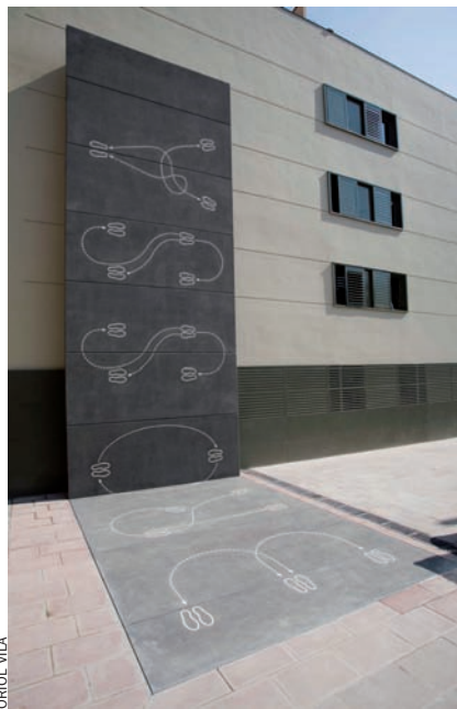
Mitgera de la Prosperitat, amb l'obra de Perejaume A Joan Brossa, a Nou Barris.

“Accions de sutura urbana”. Així anomenen els tècnics de l'ajuntament de Barcelona la integració dins el teixit urbà d'aquests murs oblidats, degradats o malmesos. Una integració promoguda mitjançant un programa de reforma gestionat per l'Institut del Paisatge Urbà i la Qualitat de Vida. Es tracta de donar dignitat a aquests espais que queden en un estat de provisionalitat que pot arribar a durar més de quaranta anys. Des de l'institut asseguren que no decoren ni utilitzen aquestes parets com a pretext de comunicació artística. Simplement hi fan petites accions de microcirurgia, i de vegades hi incorporen elements singulars, recosint aquests espais per a retornar-los la dignitat i l'equilibri perduts. Els tècnics de l'institut comparen el cas de Barcelona amb el de París, on el nombre de mitgeres és molt menor, i expliquen que allà sí que aprofiten aquests espais per a decorar-los. En canvi, en el cas barceloní s'intenta que passin desapercibuts, com una part més de la ciutat i –de vegades–, perquè tinguin un plus de qualitat, hi afegeixen un poema o una escultura. L'institut treballa a favor d'un confort més gran dins els habitatges i malda per aconseguir més sostenibilitat. S'ocupa, per exemple, d'aïllar les cases del fred i de la humitat, o bé obre finestres, si es pot, en parets on abans no n'hi havia.