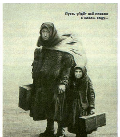
D'esquerra a dreta i de dalt a baix: vídeo de la detenció de l'activista Aleksei Navalni; curt que espera els ciutadans a manifestar-se; enfrontament amb les joventuts de Rússia Unida; bústia que amaga policies; caricatures de Medvédev jugant a la PlayStation i de Putin i Medvédev, emigrants.