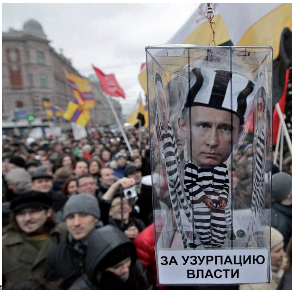
Les acusacions de frau a les eleccions russes amenacen realment, per primera vegada, l'era Putin,

Aquesta vegada, però, molta gent està indignada per coses que abans solien acceptar arronsant-se d'espatlles. Per a aquesta gent, Putin s'ha convertit en una mena de Brejnev etern, un símbol de l'estancament que afecta el país. El president Medvédev, que, si més no durant un temps, va encarnar l'esperança dels intel·lectuals liberals, s'ha acabat convertint en un titella, ha acceptat dòcilment d'apartar-se del camí i cedir el pas a Putin perquè repregués la presidència. La maniobra tàctica d'una direcció en tàndem amb el propòsit de mantenir el poder no ha funcionat. De fet, ha beneficiat les