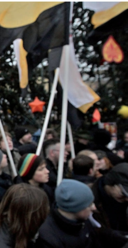
i les noves tecnologies hi han estat cabdals.

poc després. Decebutos o simplement avorrits de les infinites repeticions de l'espectacle polític de sempre, un nombre creixent de russos veuen Navalni com el polític que anhelaven. L'edició russa de la revista Esquire fins i tot va posar una foto de l'heroi a la portada.