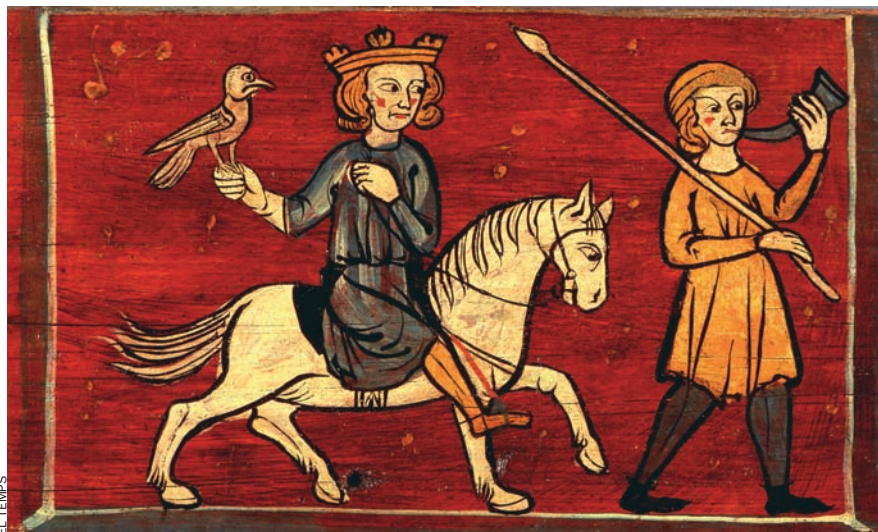
La conquesta de Jaume I (a la imatge, en l'únic retrat considerat coetani del monarca, realitzat vers el 1262), va escampar, juntament amb la llengua, també els cognoms.

El professor Enric Guinot, de la Universitat de València, ens condueix amb destresa per la història dels nostres cognoms, per la manera com hem arribat a dir-nos com ens diem avui. Una mica abans i una mica després de la revolució antroponímica del segle XI.