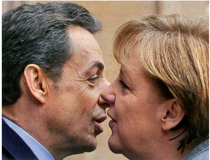
Merkel en un viatge als EUA, amb el seu marit, Joachim Sauer, el president Barack Obama i la seva dona, Michelle, davant la Casa Blanca. A la dreta, Merkel a prop del president francès, Nicolas Sarkozy.

a Nairobi, que va ser més aviat una barreja d'àpat oficial i discoteca, amb teles vermelles al saló de l'hotel, garlandes de llums de color verd, blanc i vermell, i un conjunt que sonava una mica massa a sintetitzador, però que feia una música d'allò més festiva. Merkel en va gaudir, mentre feia glops a la seva copa de vi blanc.