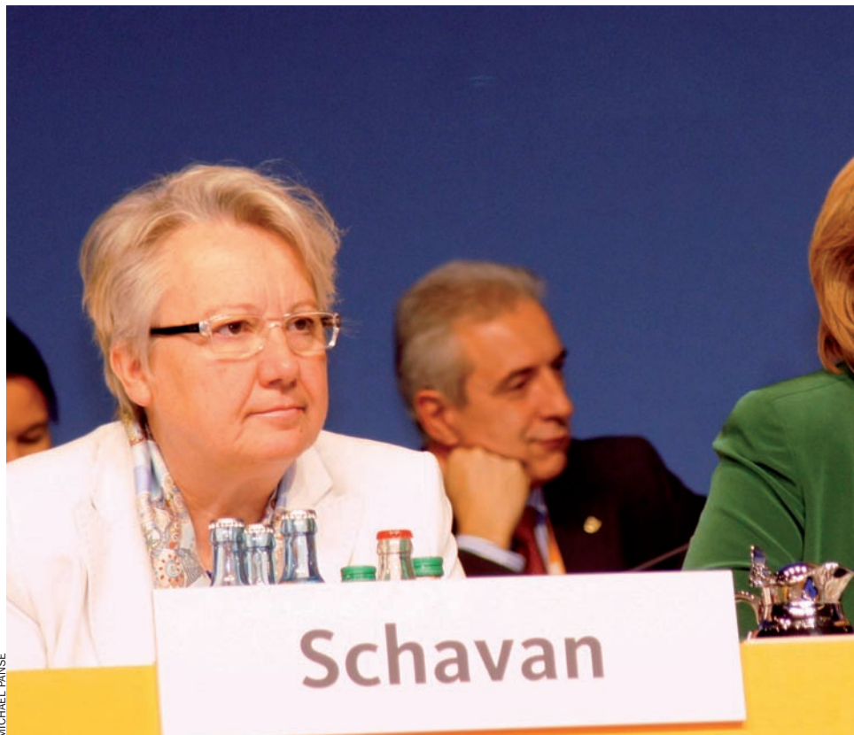
Merkel al congrés de la CDU, a Leipzig, el 15 de novembre proppassat.

Al juliol, va valorar amb escepticisme la possibilitat d'un quitament per a Grècia. Tanmateix, aquell mateix mes, per primera vegada, va mostrar-se insegura i va admetre que de vegades hi havia coses que no comprenia. A Kenya, va visitar un centre de recerca de bestiar d'explotació. Bata posada, biologia, animalons, bata fora. Al final de la visita, els inevitables li van preguntar per l'euro. Merkel els va llençar una mirada esfereïdora i, aquest cop, la cara sí que va reflectir