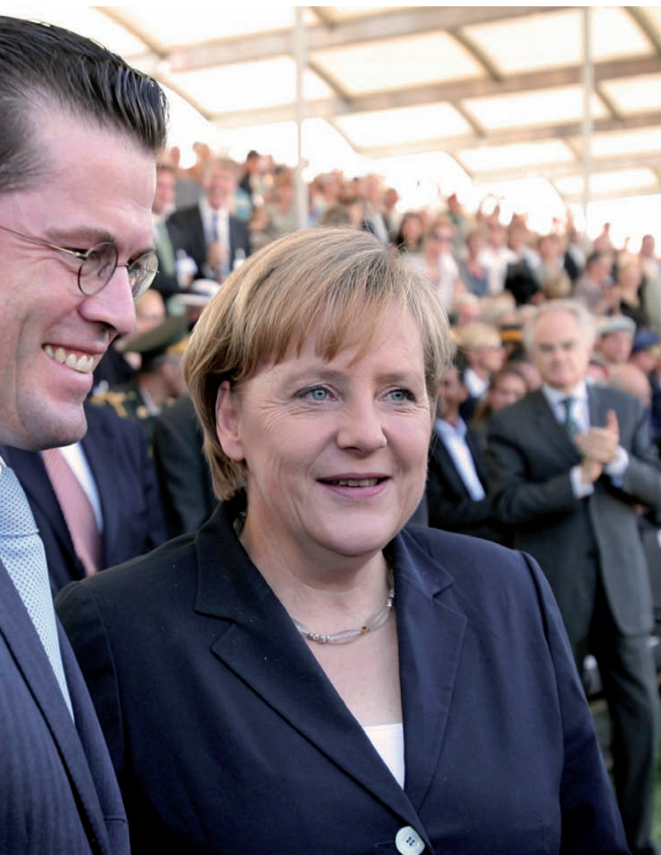
en una conferència de premsa el novembre de l'any passat.

món de la Xina, de l'Índia, del Brasil, el món dels grans pobles. Abans, eren determinants el grau de civilització, de mecanització i el poder armamentístic. Com més petites són les diferències, més importància guanyen les xifres.