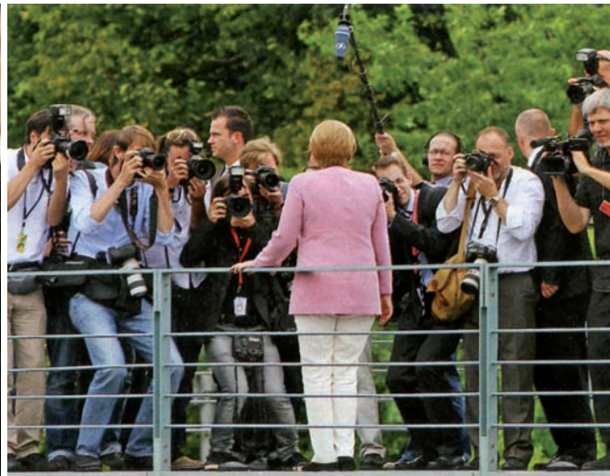
Merkel, l'oient, ho té tot previst. A la dreta, la política Merkel, a Berlín, diu al periodistes: "Okay, see you."

s'estén entre l'amor i l'odi, que en són els extrems.