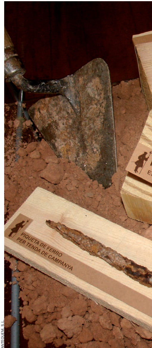
Els arqueòlegs creuen que una prospecció més

A l'est del poble, a tocar de la Torre de la Manresana, hi havia instal·lat l'exèrcit austriacista. La Torre va esdevenir l'observatori estratègic del comandament aliat, mentre Starhemberg s'instal·lava, amb el seu estat major, en una masia propera i les tropes es desplegaven entre Can Selva i Puigforner. D'una altra banda, les tropes borbòniques eren situades entre Calaf i Sant Martí Sesgueioles, i formaven un front que encerclava els Prats de Rei des del mas de l'Albareda fins a Solanelles. El principal objectiu de l'exèrcit borbònic era controlar l'altiplà calafi per tal de facilitar l'assalt definitiu de Cardona i després avançar cap a Barcelona. Així mateix, els exèrcits aliats necessitaven fer-se forts en aquesta zona per a obs-