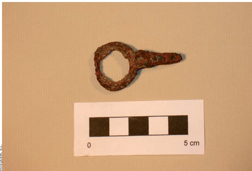
Una clau trobada al campament temporal de l'exèrcit borbònic als Prats de Rei, juntament amb una vuitantena de peces més, que han quedat dipositades a la col·lecció del municipi.

actual i la modernitat il·lustrada, que defensen els aliats i la monarquia benivolent dels Àustria, amb el suport de Catalunya, la potència constitucional i mercantil del sud d'Europa”, explica Francesc Xavier Hernández, catedràtic de didàctica de les ciències socials de la UB. Militarment, Catalunya va ser a punt de guanyar la guerra, va ser un poble en epopeia. La batalla dels Prats de Rei confirma aquest vigor bèl·lic, que va tenir continuïtat a Talamanca (Bages), on es va registrar la darrera victòria del bàndol austriacista, el 13 i el 14 d'agost del 1714. La batalla dels Prats de Rei, entre el setembre i el desembre del 1711, és la tercera en magnitud de tota la història de Catalunya: “la batalla de l'Ebre, la batalla d'Ilerda entre Juli Cèsar i els pompeians, i la dels Prats de Rei, que, de fet, era una continuació dels combats que es vivien simultàniament a la fortalesa de Cardona. És molt important numèricament i també per la duresa, perquè va tenir lloc durant l'hivern. Fou també una guerra de posicions singular que acabà oferint una moratòria a la causa aliada i frenant l'ofensiva absolutista”, relata Hernández.