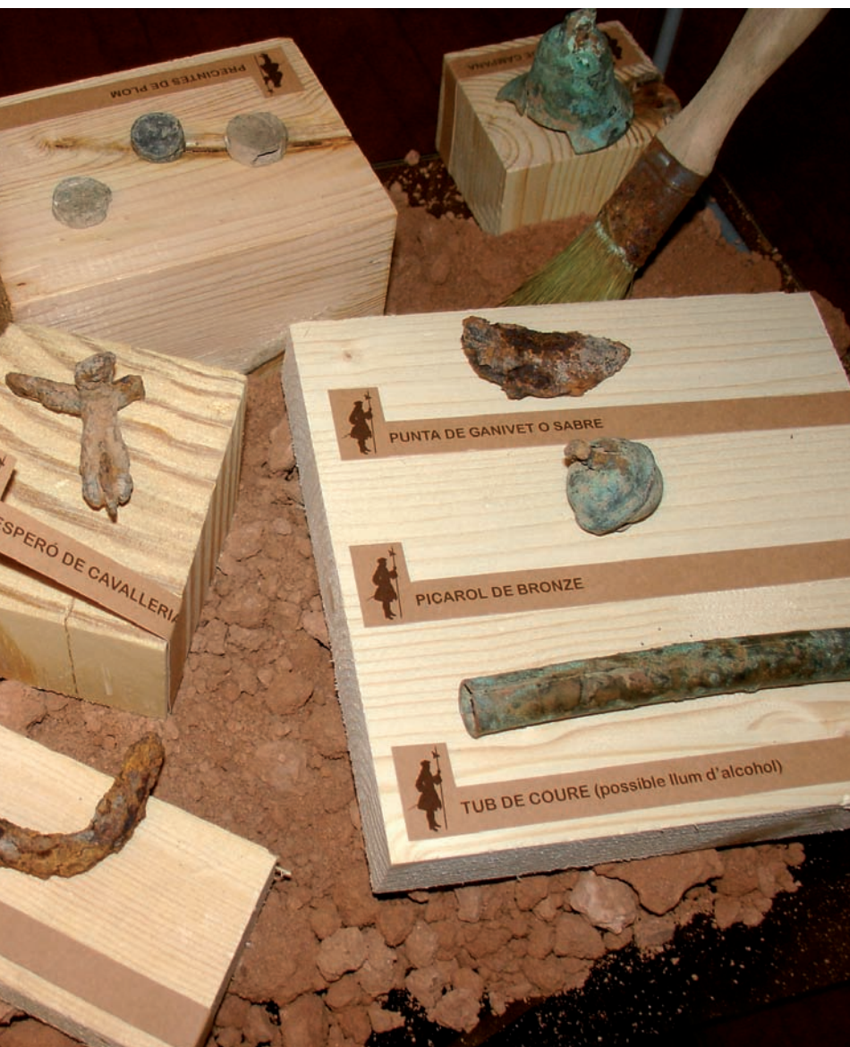
àmplia al municipi aportaria més dades sobre la batalla, en què van participar 60.000 soldats.

de canó esclatades al vessant d'un turó, fet que demostra que els austriacistes llançaven les bales des de la posició de la Torre, i no sempre encertaven el blanc, perquè algunes bales passaven de llarg i explotaven.