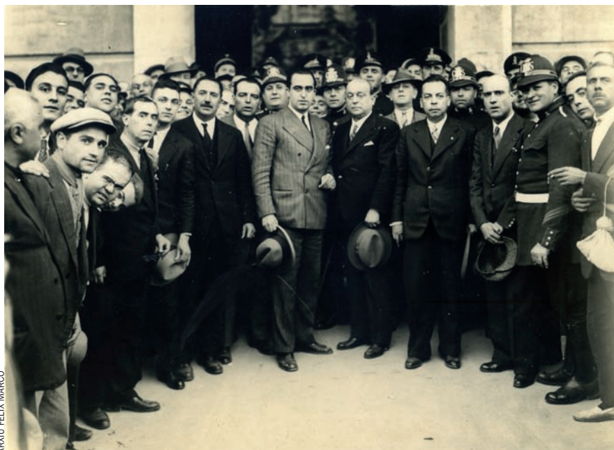
ARXIU FÈLIX MARCO