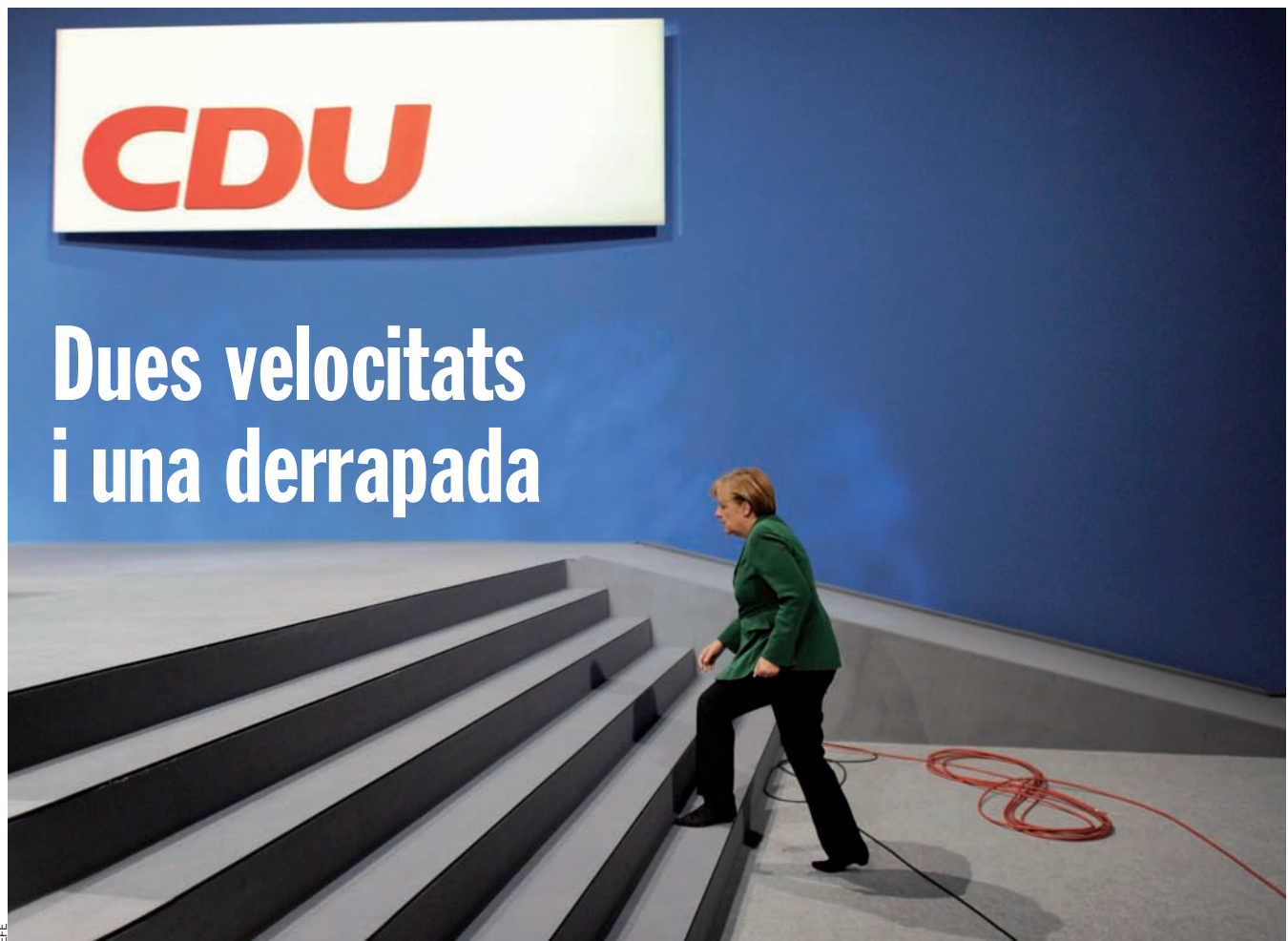
Angela Merkel, dimarts passat, quan es disposava a intervenir en el congrés de la Unió Cristiano-demòcrata (CDU), a Leipzig.

Mentre els mercats s'acarnissen amb les finances europees, la idea d'una Europa de dues velocitats insinuada per Berlín i París –i rebutjada per Brussel·les– fa via. EL TEMPS demana a un grup d'analistes econòmics la seua opinió davant aquesta perspectiva.