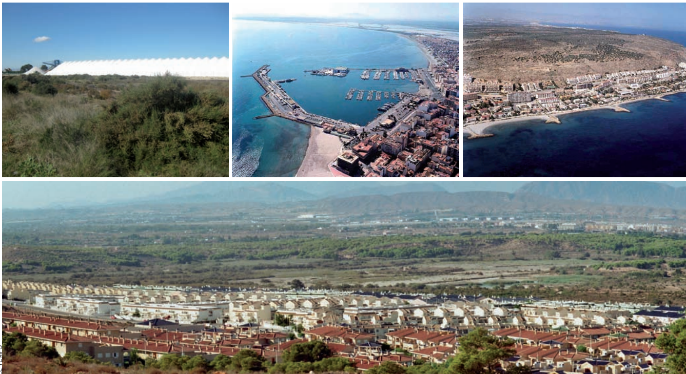
Dalt, les salines –en declivi– de Bonmatí i dues imatges aèries del centre de Santa Pola i de la seua expansió urbana. A sota, Gran Alacant.