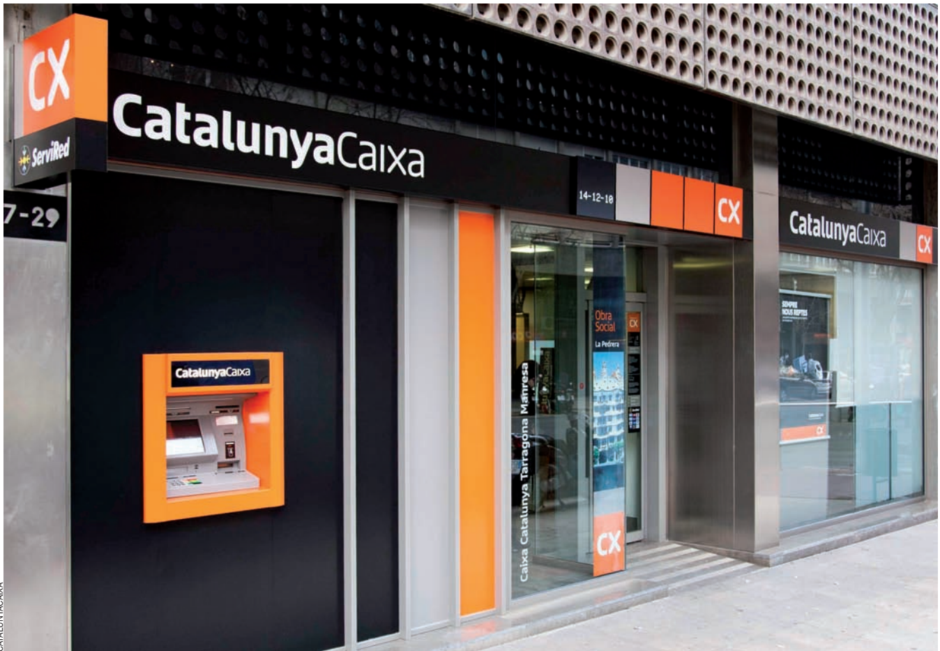
En poc més d'un any, sis caixes catalanes s'han fusionat en dos grups i han estat intervingudes. Només “la Caixa” manté intacta la independència.

L'any 1990, el govern italià promulgava la llei Amato que convidava les caixes d'estalvis i els instituts de crèdit de dret públic a convertir-se en entitats privades que compraven i venien accions. La majoria de caixes ho van fer, atretes pels incentius fiscals potents tant per a la transformació en societats anònimes com per a les fusions i absorcions que se'n derivessin. Es matava així la competència ideològica d'unes entitats financeres arrelades al territori i amb sensibilitat social, que feien nosa als grans banquers. Des d'aleshores i fins al 2008, van desaparèixer 154 caixes d'estalvis italianes. L'única entitat que va conservar la forma jurídica originària després de l'aprovació de la llei va ser el Monte dei Paschi di Siena, però