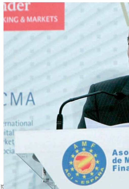
El governador del Banc d'Espanya, Miguel Ángel Fernández Ordóñez, és criticat pel pla de