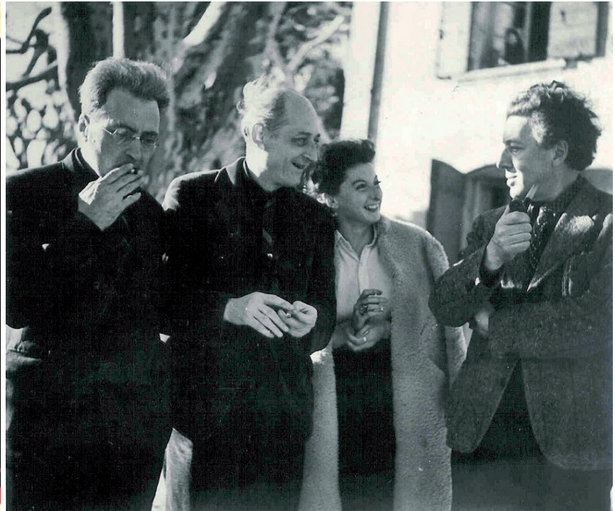
El llibre Les Protocoles des Sages de Sion va fer creure que hi havia una conspiració jueva mundial. Victor Serge va desmuntar l'engany. El 1941 és a Marsella, amb el poeta Benjamin Péret, la pintora Remedios Varo i l'escriptor André Breton, tot esperant d'embarcar cap a Mèxic.

el filòleg que va tenir cura de l'edició definitiva de l'autobiografia de l'escriptor, Mémoires d'un révolutionnaire 1905-1945 .