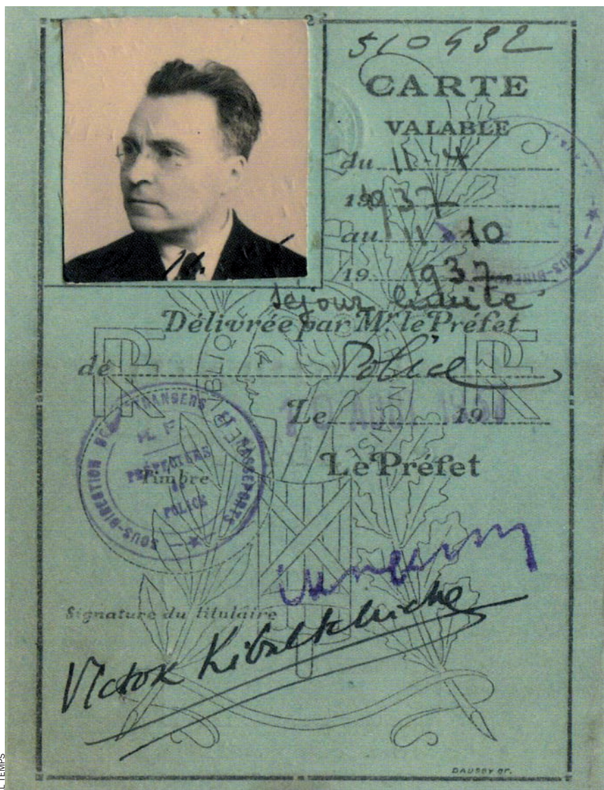
Carnet provisional que la policia de París va expedir el 1937 a nom de Victor Kibaltchitch, conegut públicament com a Victor Serge, pseudònim que adopta a Barcelona, el 1917.

Els anys 1938 i 1939 era difícil de trobar tribunes d'esquerra per a denunciar la persecució nazi contra els jueus i l'antisemitisme a França, si eres enemic de Stalin i, per tant, dels comunistes francesos. Victor Serge, però, ho va intentar.