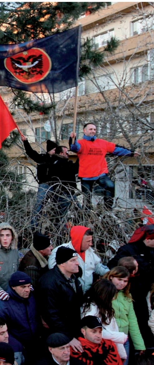
caldre anys de treball previ.

no han sabut crear institucions: l'Autoritat Palestina ha estat incapaç de crear a Cisjordània serveis per a la ciutadania (ha fet més feina Hamàs a Gaza, en aquest sentit) i això els deslegitima com a estat.”