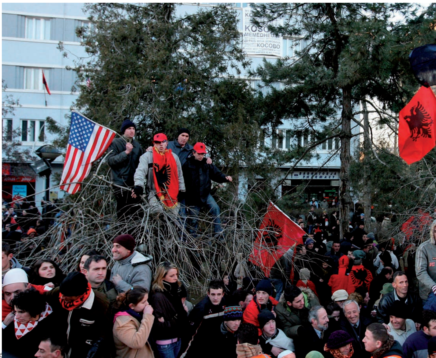
Els ciutadans de Pristina celebraven la declaració unilateral d'estat independent de Kosovo el febrer del 2008. Per a arribar a la independència van

vàlid l'endemà. S'ha d'arribar a acords oberts, transparents, que impliquen tota la població, i fins i tot els qui no volen parlar català, a més dels universitaris, els sindicats, les empreses, 'la Caixa' o el Barça. Després tindrem un estat amb una legitimitat total. La independència ha de ser un projecte de tota la població, fins i tot dels qui no volen la independència.”