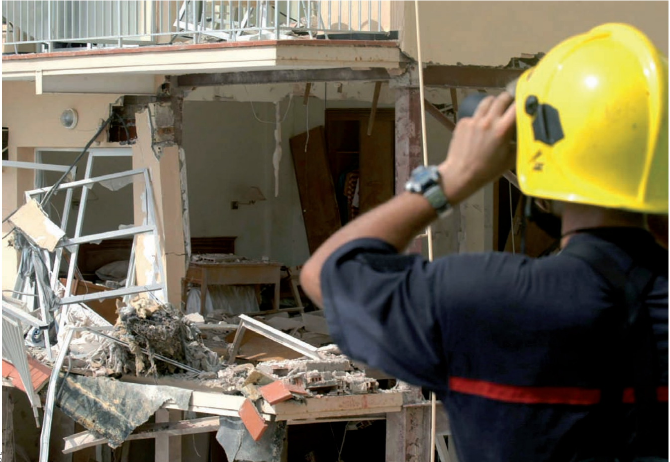
Un bomber supervisa els danys causats per la bomba que ETA va col·locar a l'hotel Nadal de Benidorm. Fou el 22 de juliol del 2005.