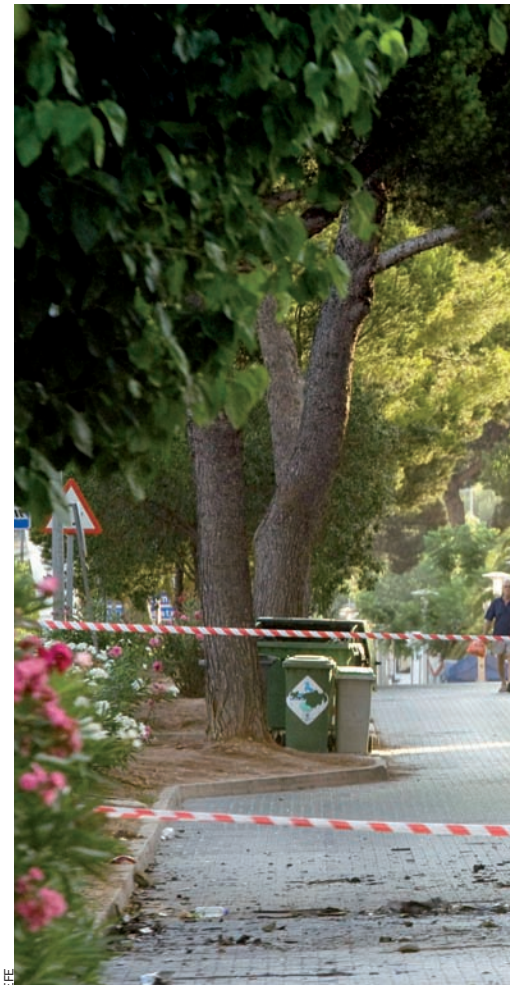
El juliol del 2009, ETA va cometre un atemptat a

Quasi al mateix temps, en una altra barriada de Palma esclatava un altre artefacte de potència menor, situat davant un xalet antic on vivia un oficial de l'exèrcit. I, simultàniament, en un altre carrer de la ciutat, el carrer Missió, experts de la policia espanyola desactivaven un tercer explosiu.