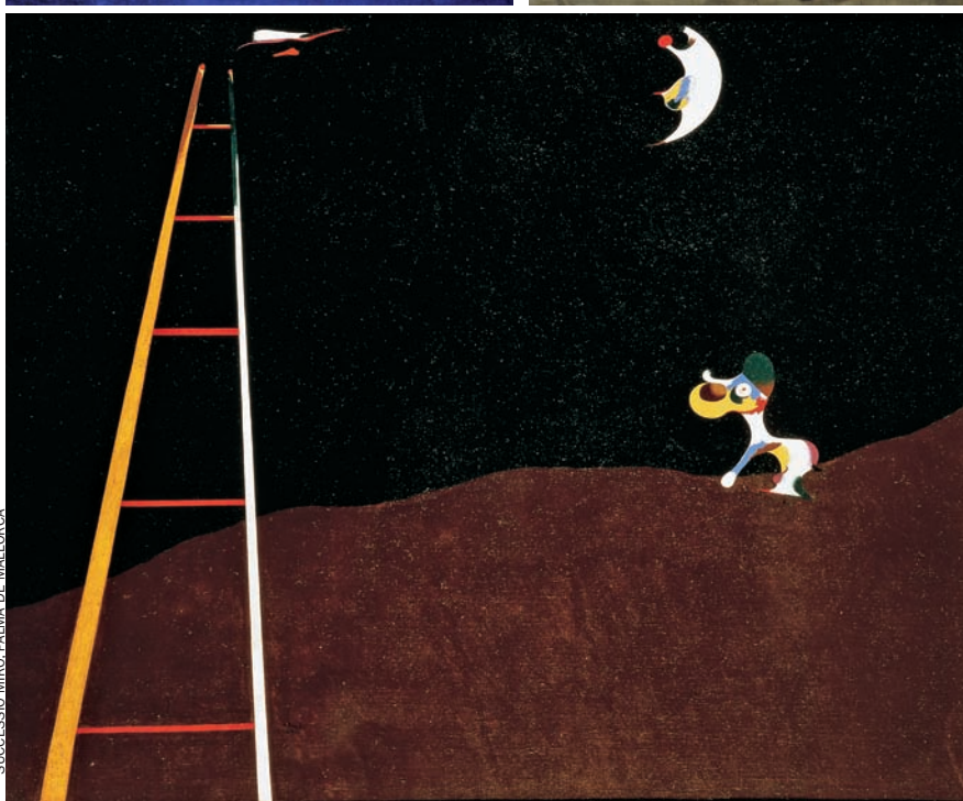
SUCCESSIÓ MIRÓ, PALMA DE MALLORCA