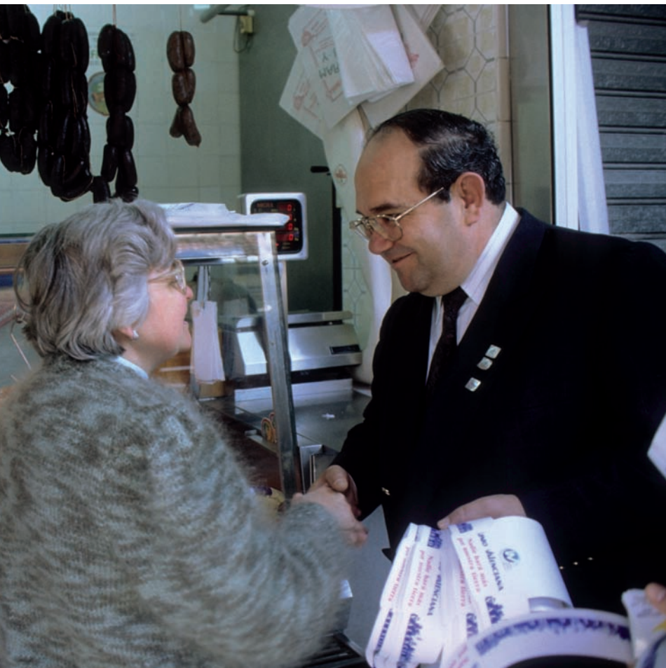
històric d'UV, mort l'any 1996, reparteix propaganda del seu partit durant una campanya electoral.

Chiquillo, ex-president de la formació regionalista, ocupava un escó a Madrid.