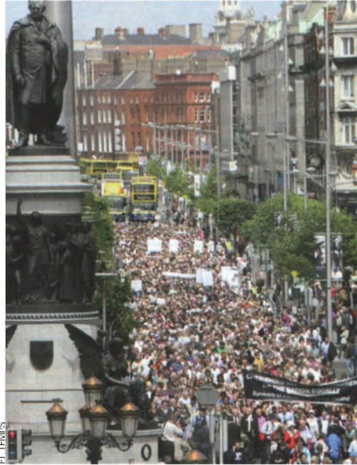
A l'esquerra, manifestació de les víctimes d'abusos a Dublín, l'estiu del 2009. A la dreta, el primer ministre irlandès, Enda Kenny.

El ministre de Justícia, Alan Shatter, ja treballa en una llei que ha d’establir la protecció dels infants “pel damunt