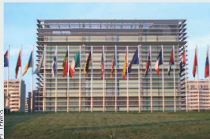
El centre d’investigació Príncep Felip

El centre d’investigació Príncep Felip, impulsat per la Generalitat i inaugurat l’any 2005 per a convertir-se en l’estendard de la investigació al País Valencià, camina cap a la desintegració. Les dificultats financeres (la Generalitat hi va destinar 9,8 milions l’any 2009, 6 milions el 2010, 4,6 enguany, i en preveu 2,2 per a l’any vinent) han acabat precipitant la fallida d’una institució que va nàixer amb greus mancances de gestió i amb un gust desmesurat pels fitxatges estrellats, segons que han denunciat els treballadors. Tot plegat, va motivar