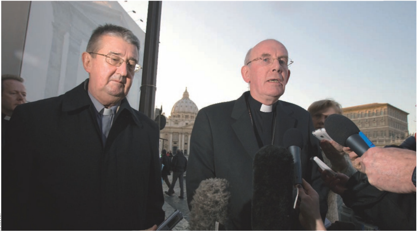
El cardenal Seán Brady (a la dreta), primate d'Irlanda, acompanyat de l'arquebisbe de Dublín, Diarmuid Martin, en sortint de la reunió que van tenir al Vaticà, el novembre del 2009, amb el papa Benet XVI, que va declarar que compartia "la indignació, la traïció i la vergonya" del poble irlandès.