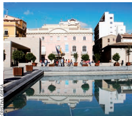
Plaça de l'Almoïna, a València, on hi havia la casa natal de Sanchis Guarner.

Obrí els ulls en un temps d'injustícies i misèries, d'inestabilitat política i violència social, de desequilibris i crisi. Dos mesos després de la mort de Teodor Llorente, l'enemic feroç del valencianisme polític, esforçat col·laboracionista a pansir la Renaixença per a major glòria de l'espanyolisme borbònic: “Els trova-