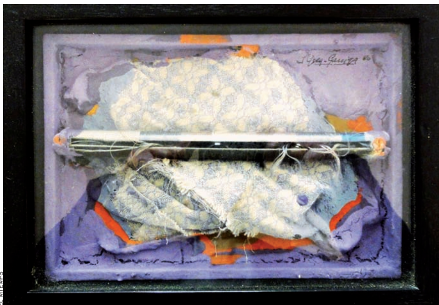
Teixit en blau, 1980. L'obra s'exhibeix a Canals-Galeria d'Art, de Sant Cugat del Vallès.

Era obvi –comenta el seu estudiós– que en la circumstància d'aquells anys 60, que culminà en els fets del maig del 68 i dels anys successius, la referència plàstica de les obres, el referent ocasional, no podia ser sinó el compromís polític i social en què –amb voluntat o sense– l'artista és sempre present i inclòs. Uns títols poden advertir a l'observador, no amatent a la circumstància de la seva execució