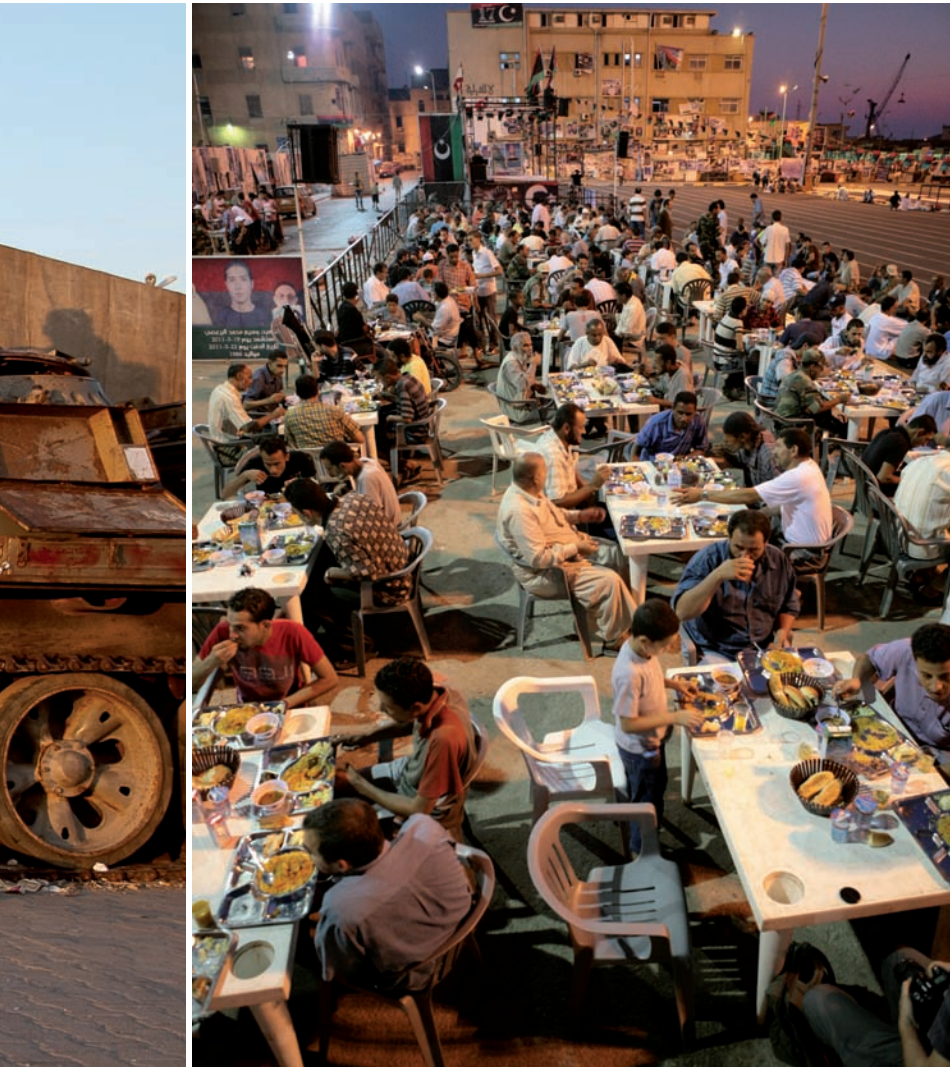
després del dejuni, a la plaça de la Llibertat de Bengasi, el dia 8 d'agost.

conflicte que els rebels s'enfrontaven contra ciutadans, una situació que qüestionava quins eren en realitat els agents en conflicte en aquesta guerra. A partir d'aquell moment, Ajdabiya, Brega i Ras Lanouf, les tres ciutats que es troben a la part est del golf de Sirte, marcaven el front est de la guerra civil líbia, a pocs centenars de quilòmetres de la capital rebel.