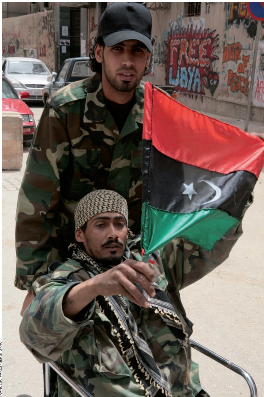
FRANCESC PARÉS / SERGI GRAU

Voluntaris rebels a Ajdabiya, uns 160 quilòmetres al sud de Bengasi. Aquesta ciutat va ser alliberada abans de l'entrada en acció de l'OTAN.