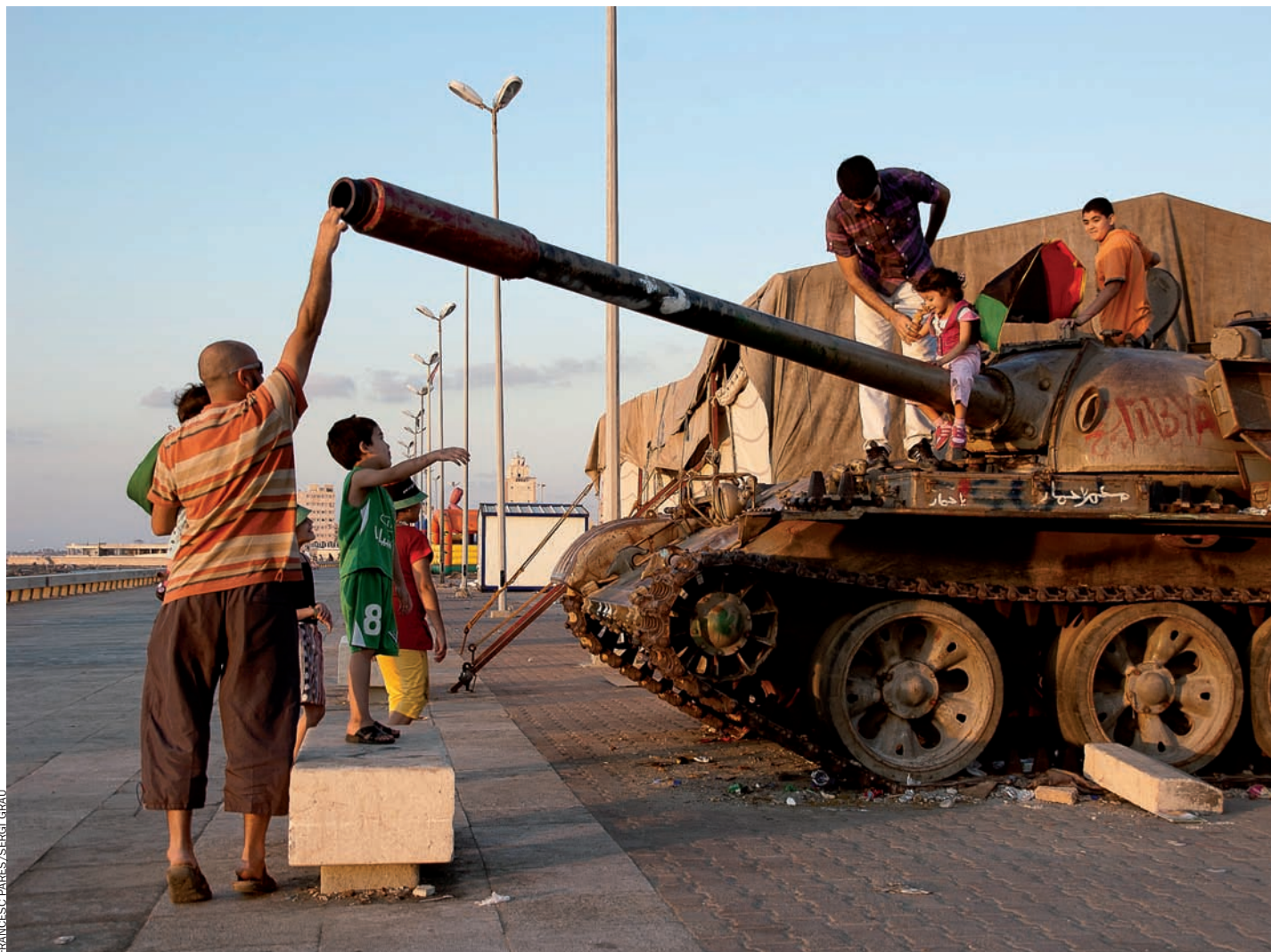
FRANCISCA PARÉS / SERGI GRAU