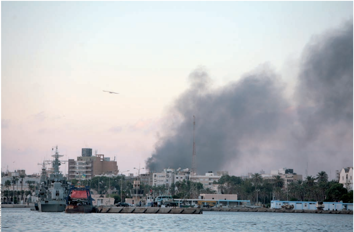
FRANCESC PARÉS / SERGI GRAU

Columna de fum a la ciutat de Bengasi després d'una confrontació entre grups, el dia 13 d'agost proppassat.