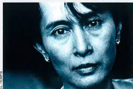
Aung San Suu Kyi va tenir una reunió amb representants del Govern birmà.

La premi Nobel de la Pau Aung San Suu Kyi, líder de l'oposició a Myanmar, s'ha reunit oficialment amb el ministre de Treball de Birmània, Aung Mye Thaw, el seu únic contacte amb el règim militar, i amb qui ja es va trobar el 25 de juliol. La reunió tenia lloc dos dies abans de l'anunciada visita de la líder del moviment democràtic a Bago, una zona del país a vuitanta quilòmetres de la capital, Rangun, per la qual cosa havia estat amenaçada pel ministre de l'Interior. Des d'aquest mateix departament se l'ha advertit que no pot tenir l'oficina de la Lliga Nacional Demo-