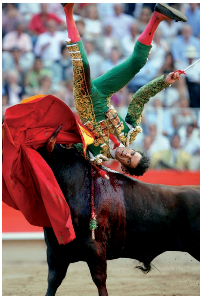
A l'esquerra, el document de la Peña de Badalona per recollir signatures pels toros. A la dreta, una enganxada de José Tomàs a la Monumental.