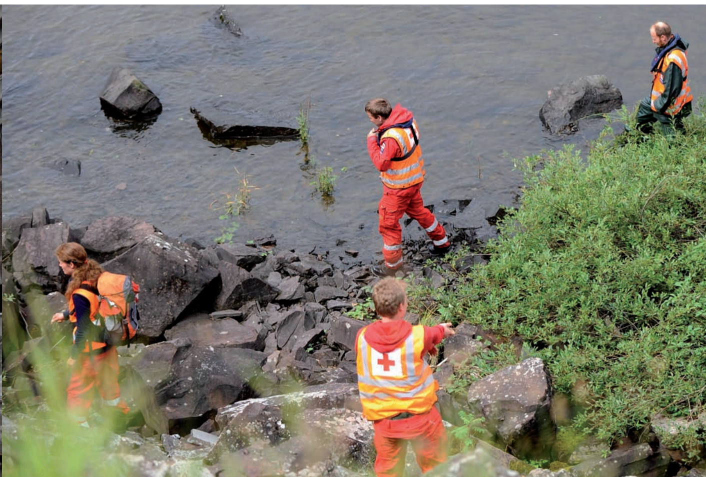
borista, Breivik va assassinar a trets seixanta-vuit joves, dels quals almenys trenta-un eren menors d'edat.

on esmenta que Uthman ibn Naissa, “anomenat Munussa pels francs, és el governador suplent del territori que esdevindria més endavant Catalunya”. Munussa era, presumptament, el valí d'Arbuna (Narbona), i segons Rovira i Virgili és en realitat un mite, no un personatge històric. Tot aquest apartat 20 del primer capítol (1.20) del llibre de Breivik, el que titula “La batalla de Poitiers (la Batalla de Tours)”, i que ocupa vint-i-cinc pàgines (de la 219 a la 234), és una còpia gairebé exacta (en un 95 %) de l'article de la Viquipèdia sobre aquesta batalla, inclosos el títol, els titolets i els mapes. Totes les referències a Catalunya que surten en aquest llarg apartat són clavades a les de la Viquipèdia.