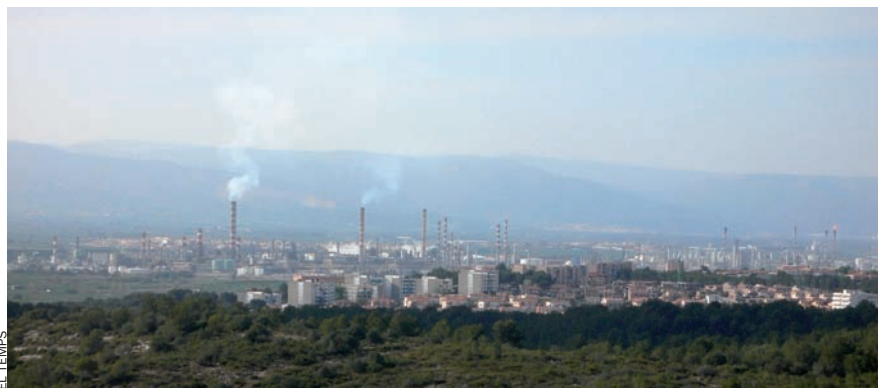
La central nuclear de Cofrents (Vall d'Aiora) i la refinera del Camp de Tarragona són, com totes les nuclears i refineries dels Països Catalans, potencials objectius de "sabotatge", segons apunta Breivik al seu llibre.