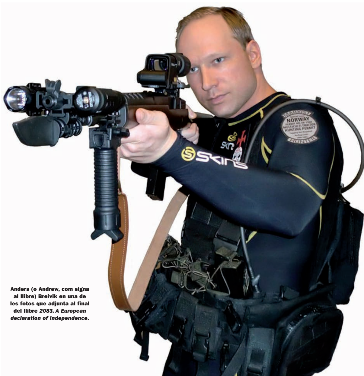
Anders (o Andrew, com signa al llibre) Breivik en una de les fotos que adjunta al final del llibre 2083. A European declaration of independence .

L'assassí que va colpir Noruega i Europa sencera el divendres 22 de juliol amb sengles atemptats a Oslo i a la propera illa d'Utoya és el presumpte autor d'un volum de 1.518 pàgines que va penjar a la xarxa i, uns dies abans, va enviar a un miler de persones –la majoria membres de partits d'extrema dreta– de Noruega, el Regne Unit, França i Alemanya.