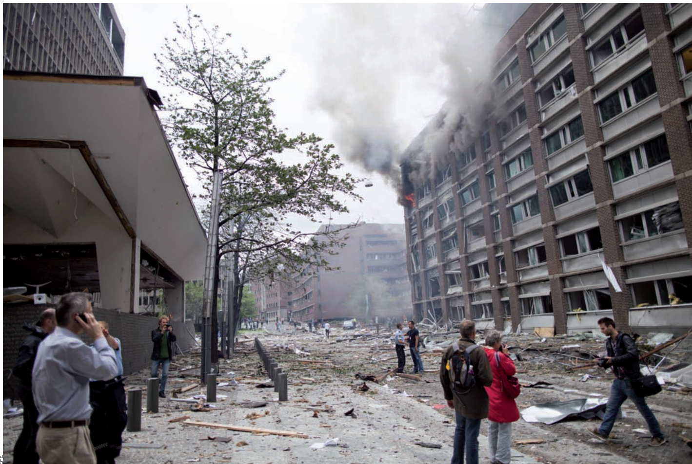
A Oslo, la capital noruega, l'atemptat de Breivik va matar vuit persones. A l'illa d'Utoya, on se celebrava una reunió de les joventuts del Partit La-

Humanistes Suïcides dels Països Catalans. Allà on surten citats Catalunya, el País Valencià i les Illes Balears és a l'apartat 43 del capítol o llibre (com els anomena Breivik) número 3. Es titula “Partits polítics que donen suport al multiculturalisme” i no és exhaustiu. Sota l'epígraf “Spain”, enumera els partits que considera “marxistes culturals/humanistes suïcides/capitalistes globalistes”. Hi ha el Partit Socialista Obrer Espanyol, que, diu Breivik, està format pel “Partit dels Socialistes de Catalunya, Partido Socialista de Euskadi, Euskadiko Ezkerra, Partido dos Socialistas